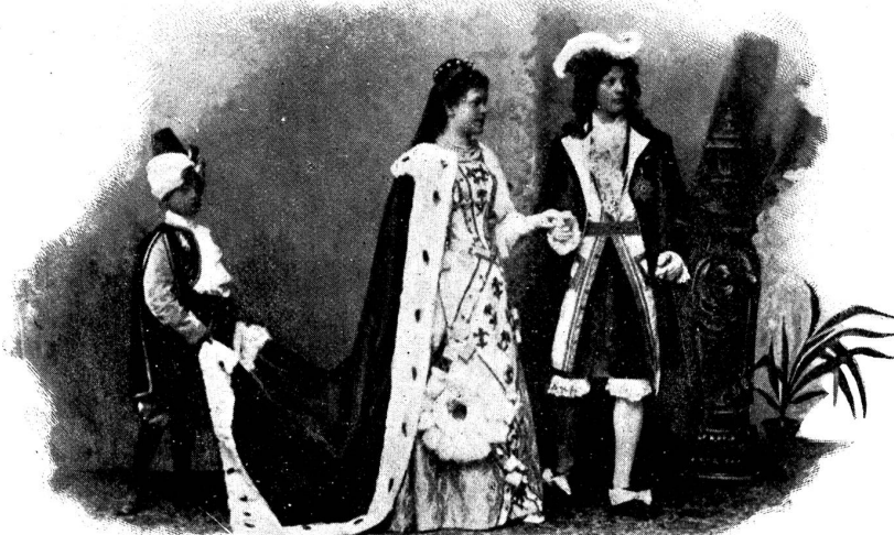
Märchen vom gestiefelten Kater: Das Fürstenpaar.