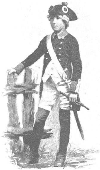
Marauer Kadett von 1798.

Der Landvogt von Wattenwyl, in Begleitung der Cavaliere und des Standesweibels von Bern, racht als Diplomat der Linmatfart, welche zu seinem Empfang die mit Hellebarde, Pike und Partisane ausgestattete Jungmannschaft entgegenendet, einen würdevollen, freundlichen Einzug bereitend.