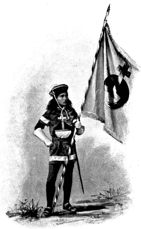
Bannerträger von Bickten.