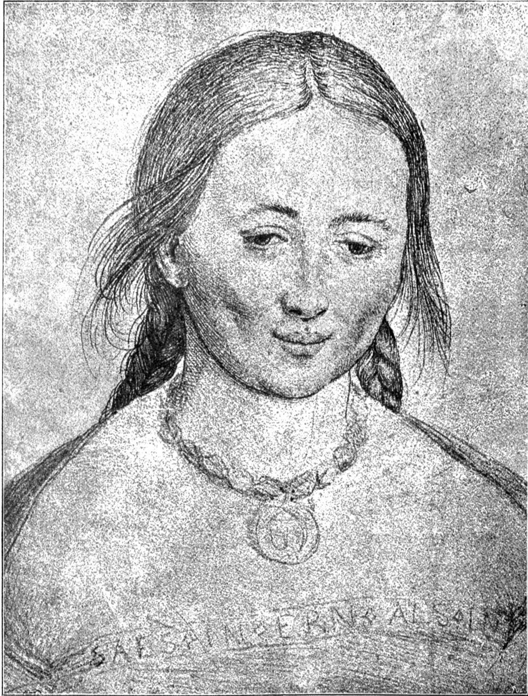
Abb. 2. Studie zur Better'schen Madonna von Solothurn. v. Holbeins Zeichnung in Silberstift, Rotstift und Tusche im Louvre zu Paris (Sammlung Jabach).