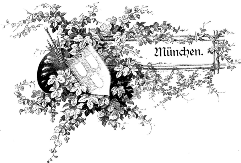
Kopfleiste des München-Kapitels.