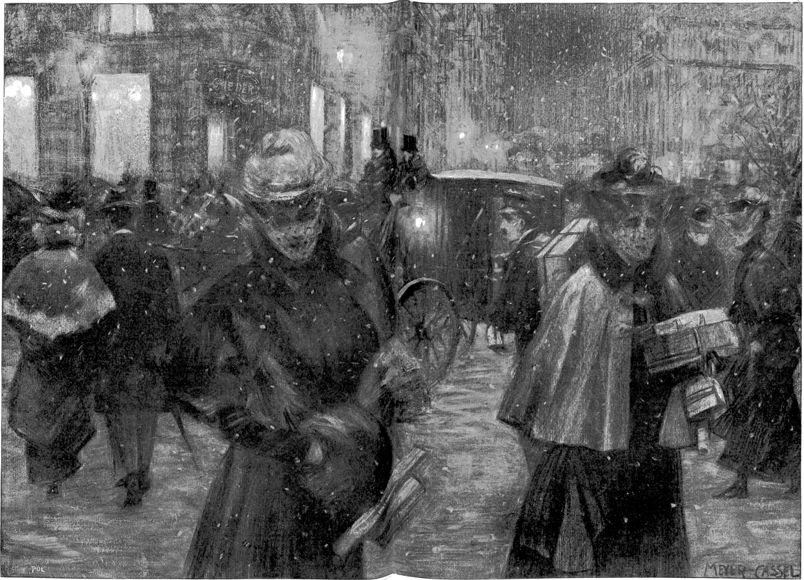
Weihnachtseinkäufe. Originalzeichnung von G. Meier-Cassle.