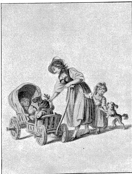
Familienidyll. Nach Freudenberger.