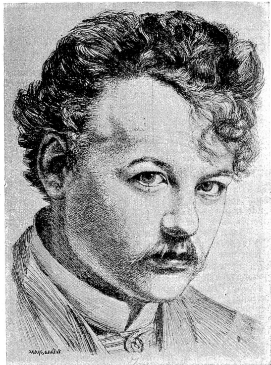
Selbstporträt Karl Staufers. Nach einer Radierung. Mit gütl. Erlaubnis der Kunsthandlung Amster & Rütardt abgedruckt.

Eine grüne Wiese. Und in der grünen, sonnenbeschienenen Wiese zwei große, farbige Flecken, ein roter und ein blauer. Die Flecken bewegen sich. Sie werfen blaue Schatten, die langgestreckt über die Wiese laufen. Jetzt nähern sie sich. Die zwei Flecken verwandeln sich in zwei kleine Kinder. Zwei winzige runde Geschöpfchen. Sie haben beide hellblondes Kraushaar und weit offene blaue Augen. Sie halten sich an den dicken Händchen und zotteln eifrig vorwärts. Aber die Sache ist nicht leicht. Bald liegt das eine, bald das andere auf der