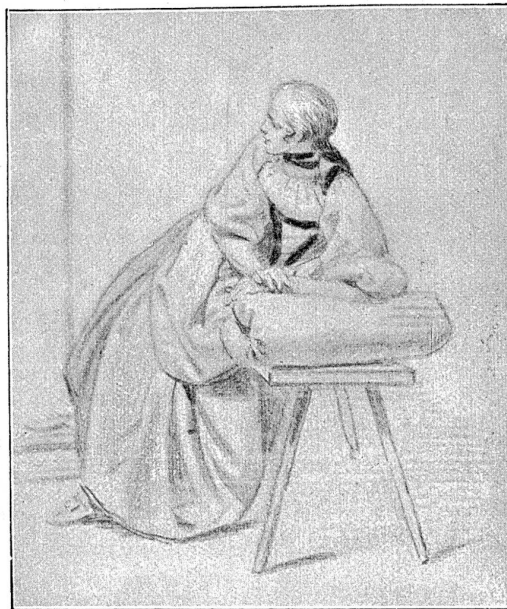
Berner Mädchen. Nach Freudenberger.