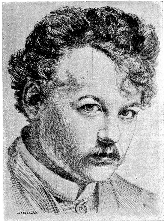
Selbstporträt Karl Staufers. Nach einer Radierung. Mit gütl. Erlaubnis der Kunsthandlung Amster & Rütgardt abgedruckt.

Eine grüne Wiese. Und in der grünen, sonnenbeschienenen Wiese zwei große, farbige Flecken, ein roter und ein blauer. Die Flecken bewegen sich. Sie werfen blaue Schatten, die langgestreckt über die Wiese laufen. Jetzt nähern sie sich. Die zwei Flecken verwandeln sich in zwei kleine Kinder. Zwei winzige runde Geschöpfchen. Sie haben beide hellblondes Kraushaar und weit offene blaue Augen. Sie halten sich an den dicken Händchen und zotteln eifrig vorwärts. Aber die Sache ist nicht leicht. Bald liegt das eine, bald das andere auf der