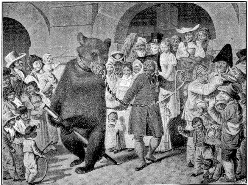
Bärenführer in Bern. Nach G. Mind.

Unser Urteil über „Die Schweiz im XIX. Jahrhundert“ können wir also knapp dahin zusammenfassen, daß diese Schöpfung, — und das Wort läßt sich mit voller Berechtigung nur auf eine in jeder Beziehung hervorragende Leistung anwenden — nicht etwa ein 'Gelegenheitsprodukt' ist, sondern eine bis in ihre geringfügigste Einzelheit durchdachte Arbeit, ein Born des Wissenswertesten, gründlich und anziehend zugleich. Es darf nicht übersehen werden, daß die Herausgeber, um ein solch umfangreiches Material zu sammeln, bedeutende