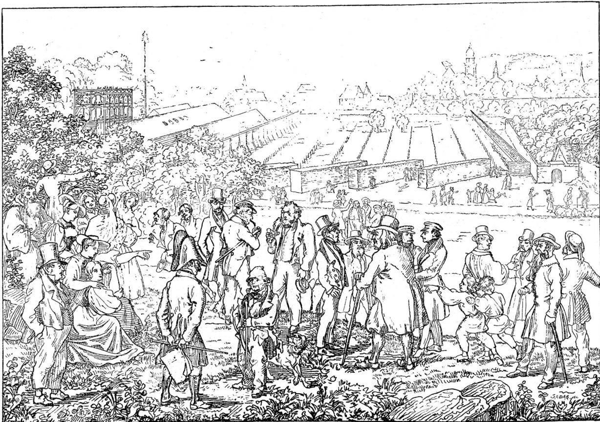
Eidgenössisches Freischießen in Solothurn (1840). Nach Disteli.

Erde. Die runden nackten Beinchen zappeln über dem hohen Niedgras. Dann bleibt das zweite stehen, läßt das Mäulchen