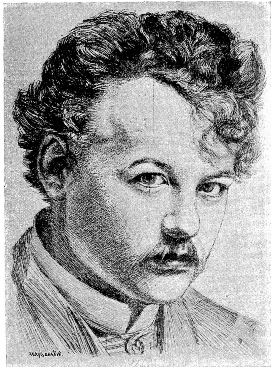
Selbstporträt Karl Staufers. Nach einer Radierung. Mit gütl. Erlaubnis der Kunsthandlung Amster & Rütgardt abgedruckt.

Eine grüne Wiese. Und in der grünen, sonnenbeschienenen Wiese zwei große, farbige Flecken, ein roter und ein blauer. Die Flecken bewegen sich. Sie werfen blaue Schatten, die langgestreckt über die Wiese laufen. Jetzt nähern sie sich. Die zwei Flecken verwandeln sich in zwei kleine Kinder. Zwei winzige runde Geschöpfchen. Sie haben beide hellblondes Kraushaar und weit offene blaue Augen. Sie halten sich an den dicken Händchen und zotteln eifrig vorwärts. Aber die Sache ist nicht leicht. Bald liegt das eine, bald das andere auf der