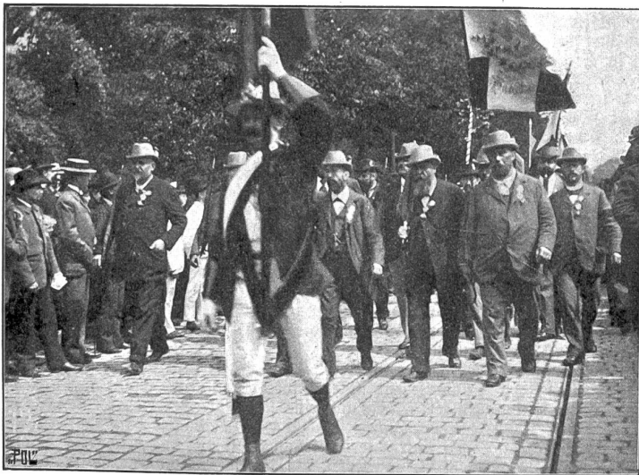
Turnfest in Hamburg: Gruppe von Schweizern im Festzuge.