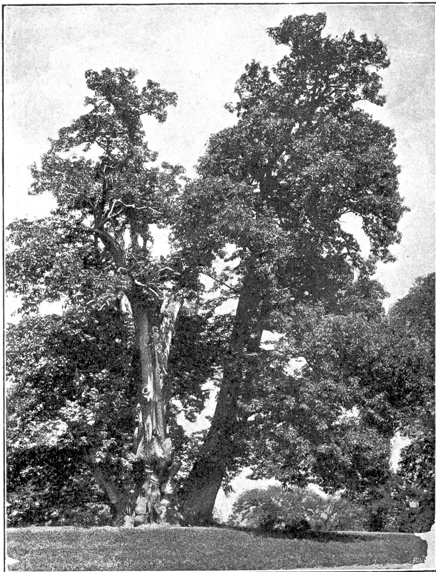
Baumbstudien von Stocker, Photogr., Lausanne. — Der große Kastanienbaum bei Evian.

noch ihre Pflicht mit dem Tode besiegelt, waren die Uebrigen nicht mehr in stande, den Anprall der Massen aufzuhalten, und dies um so weniger, als der Feind nun auch durch die Seitengänge heranstürmte. Noch ein wildes, verzweifertes Handgemenge, und dann suchte Jeder, der nicht zu Tode getroffen am Boden lag, nach einem Rettungswege.