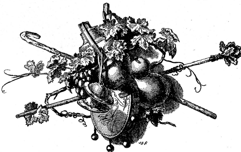
Vignette von Sal. Geßner.

Mit diesen Worten, die Claudine, mit sanfter und zugleich fester Stimme