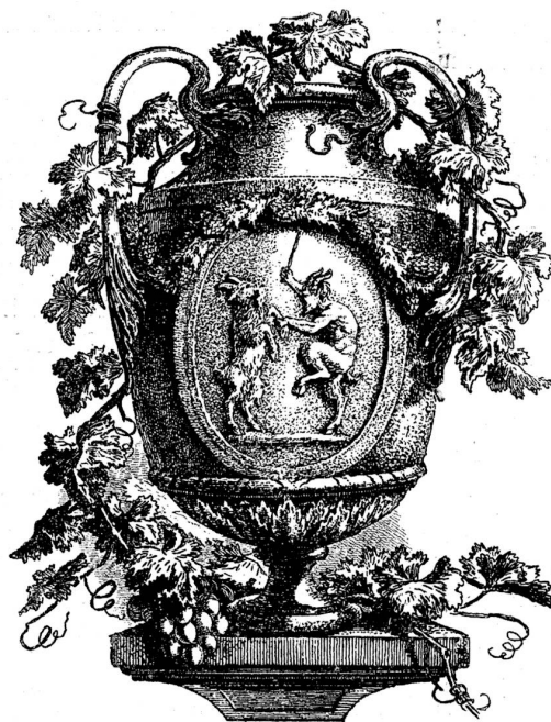
Bignette von Sal. Gessner.

Claudine von Beauval, aus einem der ältesten Ge- schlechter Frankreichs stammend, kam fast noch als Mäd- chen an den engern Hof Marie Antoinettens, der da- mals gefeierten und später so unglücklichen Gemahlin Ludwigs XVI. Bei dem Herannahen des Revolutions- sturmes war Claudine eines der vertrautesten Hoffräulein der Königin und eine der lieblichsten und wohlthwendigsten Erscheinungen in Versailles. Mitten in einer frivolen Umgebung wußte sie, ohne Brüderie, eine Sittsamkeit und demütige Jungfräulichkeit zu bewahren, die ihr die Achtung selbst der verkommensten Wüstlinge erzwingen