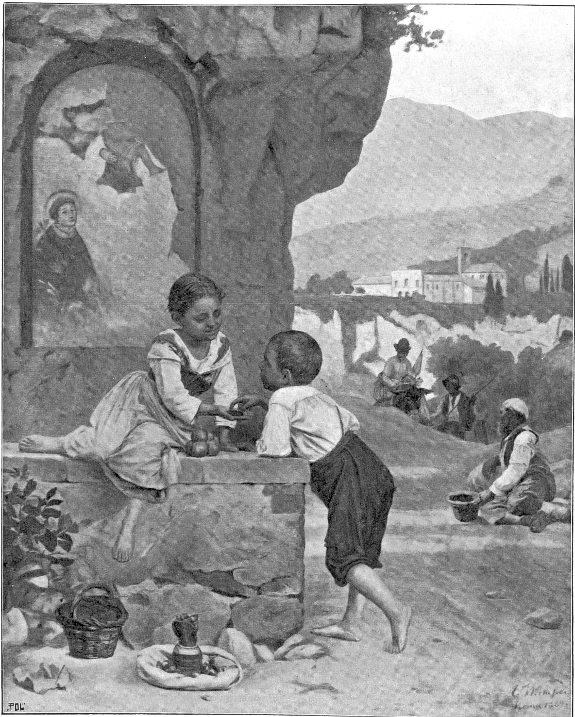
Vor einer Heiligenstation. Gemälde von A. Beckeffer (Wintertthur) in Rom.