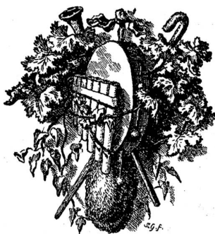
Vignette von Sal. Gschner.

gesprachen, schritt sie weiter, während der junge Offizier ihr trunkenen Blickes nachschaute, bis sie aus dem Korridor verschwunden war. „Ha, da läßt sich's sterben,“ sagte er dann leise, die Hand aufs Herz legend, vor sich hin, „wie süß auch die Lebenshoffnung winkt.“