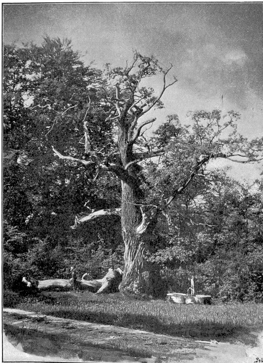
Baumstudien von Stöcker, Photogr., Lausanne. — Siehe bei Wildenstein (Zürich).

nicht erwehren, wie sehr sie ihr Herz auch in die Nähe des Mannes zog, dem sie in unwandelbarer Liebe zugethan war. So schwiegen allmählich die fruchtlosen Einladungen der Berner Patrizierfamilie, und der Hauptmann von Effingen trat in die Armee der Verbündeten, die am Rheine gegen die französischen Revolutionsheere stritt. Frau Beauval war indessen nicht mehr stark genug, den Schlägen des Unglücks, das sie betroffen, Trost zu bieten. Sie starb und ließ ihre Tochter hilflos und freudelos in der Fremde zurück. So freudelos jedoch nicht, als sie mit bitterem Schmerz in der letzten Todesstunde gedacht haben mochte; denn noch hatte Claudine in ihrem Herzeleide die Trauerbotschaft nicht nach Bern gemeldet, als eines Abends nach schon eingebrochener Nacht ein alter, aber stattlich aussehender Mann in Reifekleidern in das