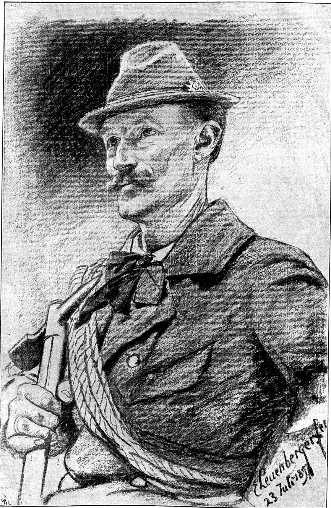
Ludwig Purtscheller.