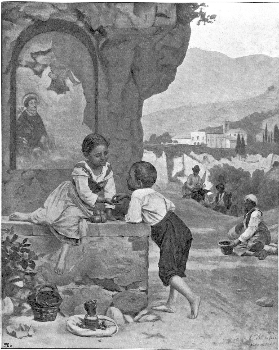
Vor einer Heiligenstation. Gemälde von A. Beckeffer (Wintertthur) in Rom.