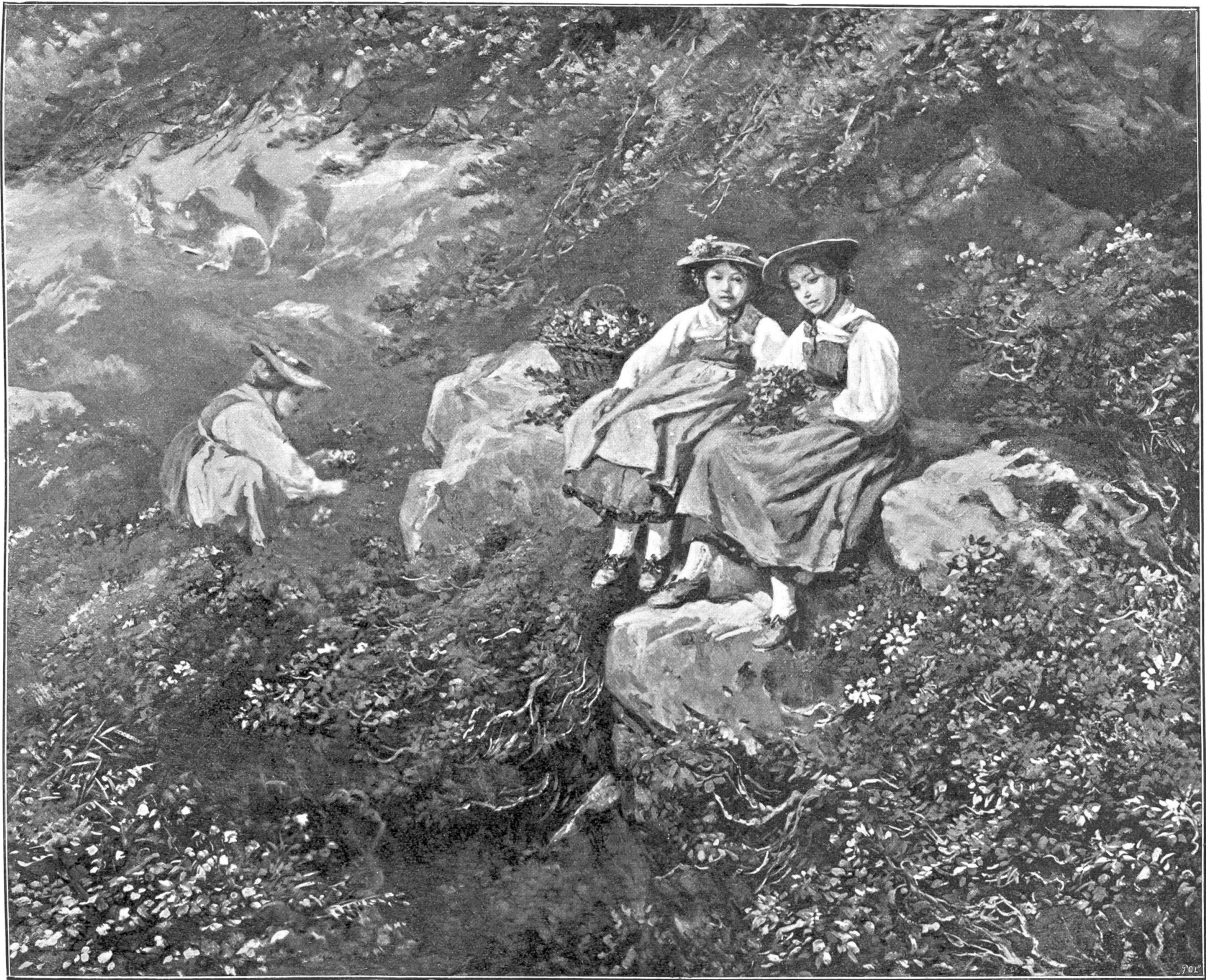
In den Alpenrosen. Gemälde von † Raphael Nis, Sitten.