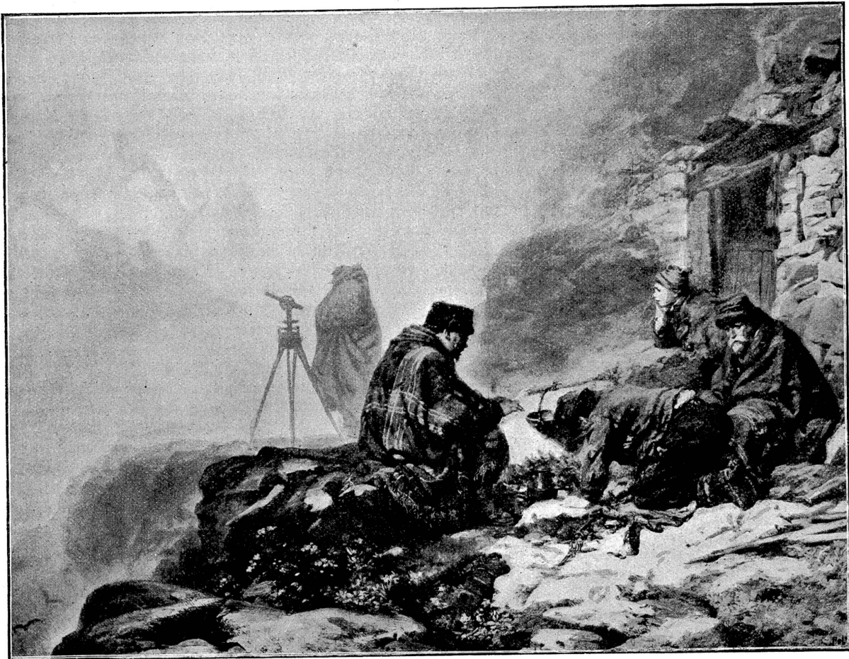
Ingenieure im Gebirge. Gemälde von Raphael Mly, Sitten.

Er trat erst in die Hütte, als drinnen jeder Licht-