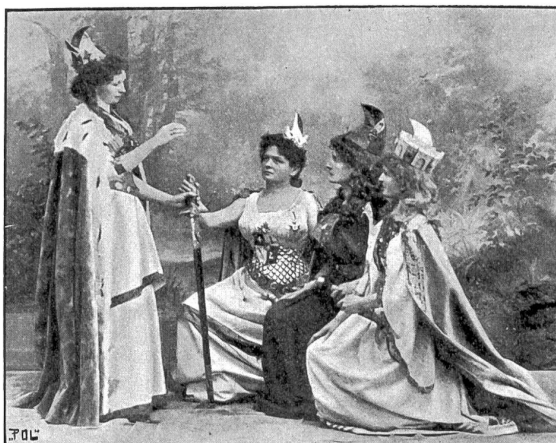
Szene aus dem Festspiel auf dem Dolber.

Es liegt zweihundert Meilen hinter dem Ende der Welt, und ein dreihundert Meter dicker Wall von Grütze umgibt das-