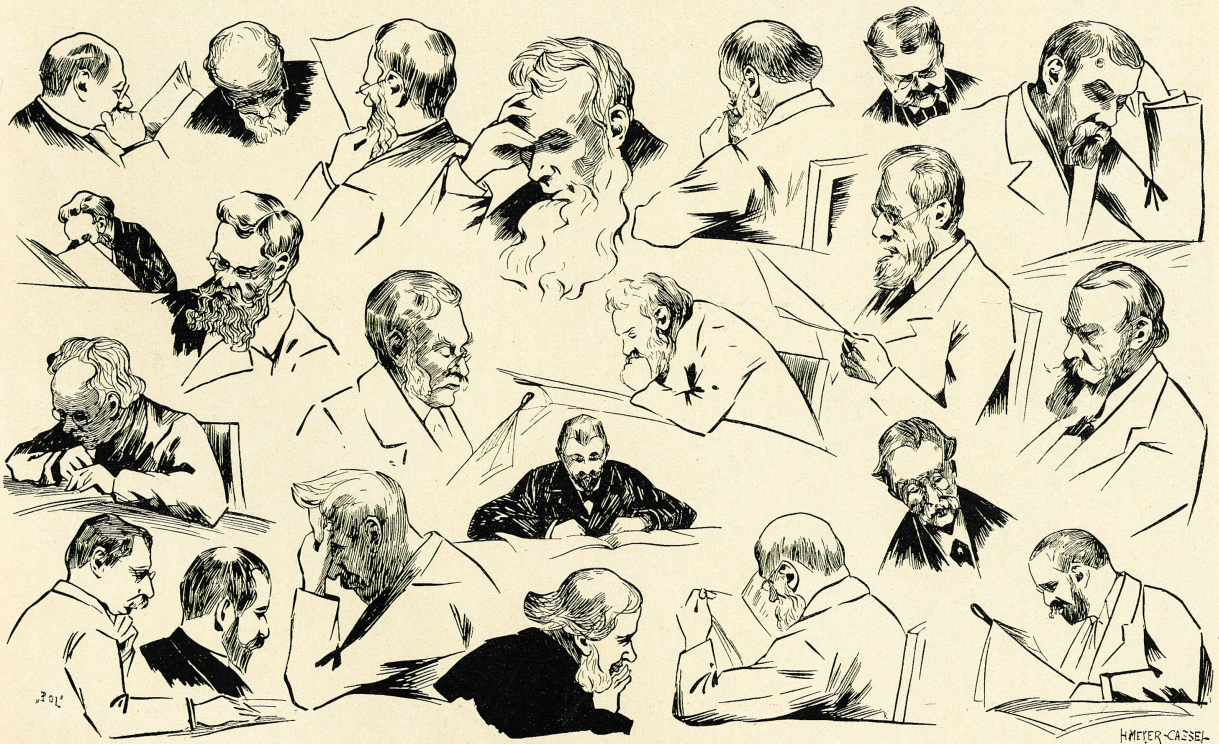
Studien aus dem Lesesaal. Von S. Meyer-Cassel.