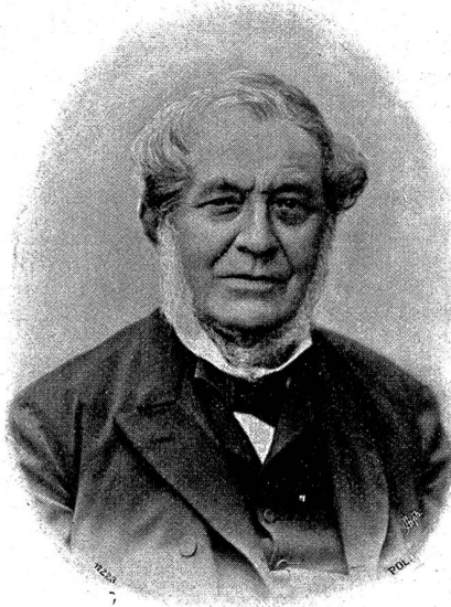
Dr. Robert Wilhelm Bunsen.

Bunsen erreichte das hohe Alter von mehr als 88 Jahren. Er studierte zuerst in seiner Geburtsstadt Göttingen, dann in Paris, Berlin und Wien, habilitierte sich, erst 22 Jahre alt, in Göttingen, übte dann die Professur aus in Kassel, Marburg, Breslau und folgte 1852 einem Rufe nach Heidelberg, wo er bis zu seinem Tode verblieb. Durch 37 Jahre war er als Professor die Zierde der dortigen Universität. Außer dem auch in Laienkreisen bekannten Bunsen-Clement und dem Bunsen- Brenner, sowie seiner bahnbrechenden Entdeckung der Spektral-