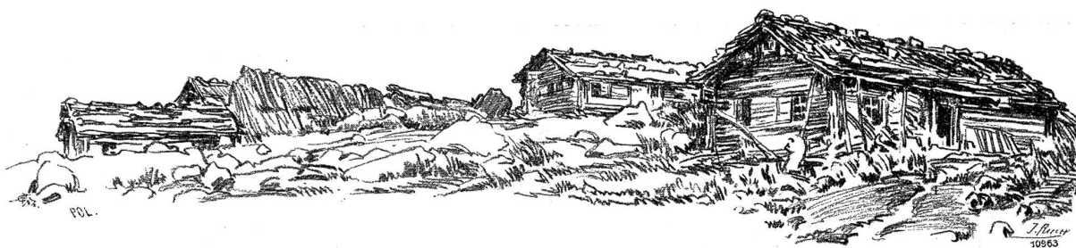
Häusergruppe auf dem Urnerboden.