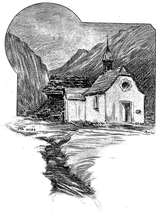
Die Kapelle auf der Gßgeneralp.

heiß und süß und rot — wie Blut. Heute steht Heinrich an ihrem Lager. Er hält ihre Rechte in der seinen wie — wie damals.