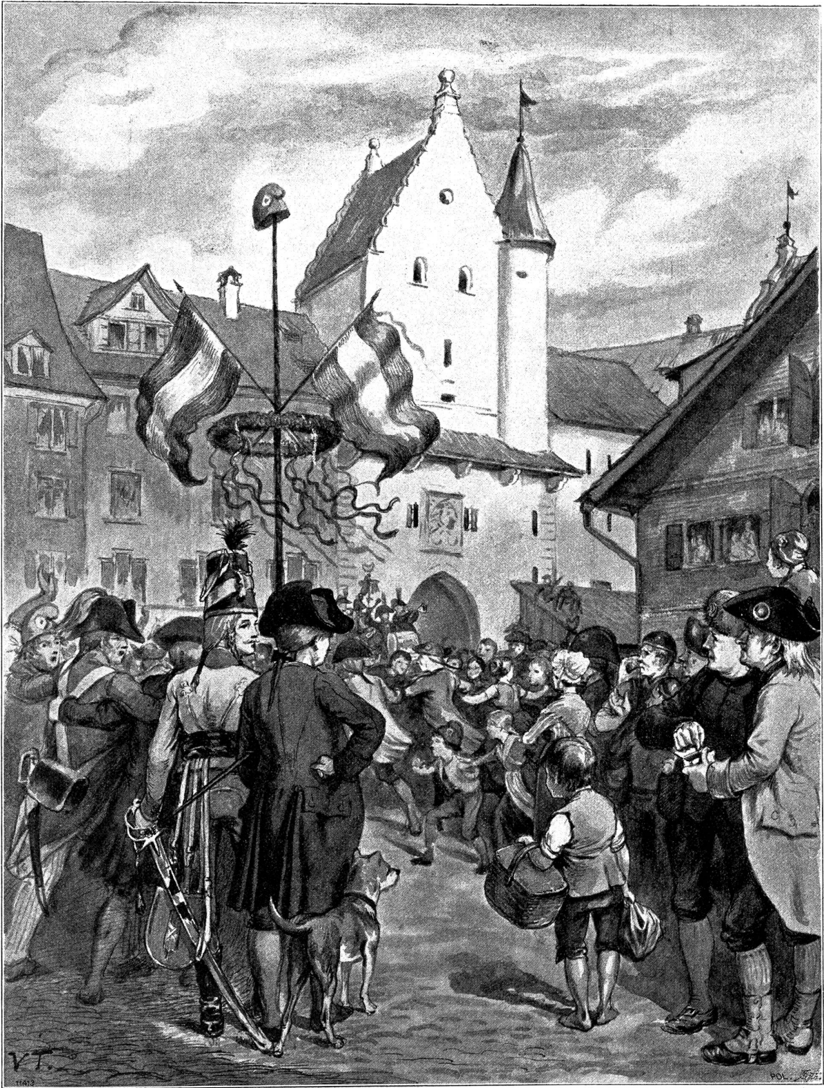
Der Freiheitsbaum in St. Gallen. Originalzeichnung von Prof. Viktor Tobler, München.