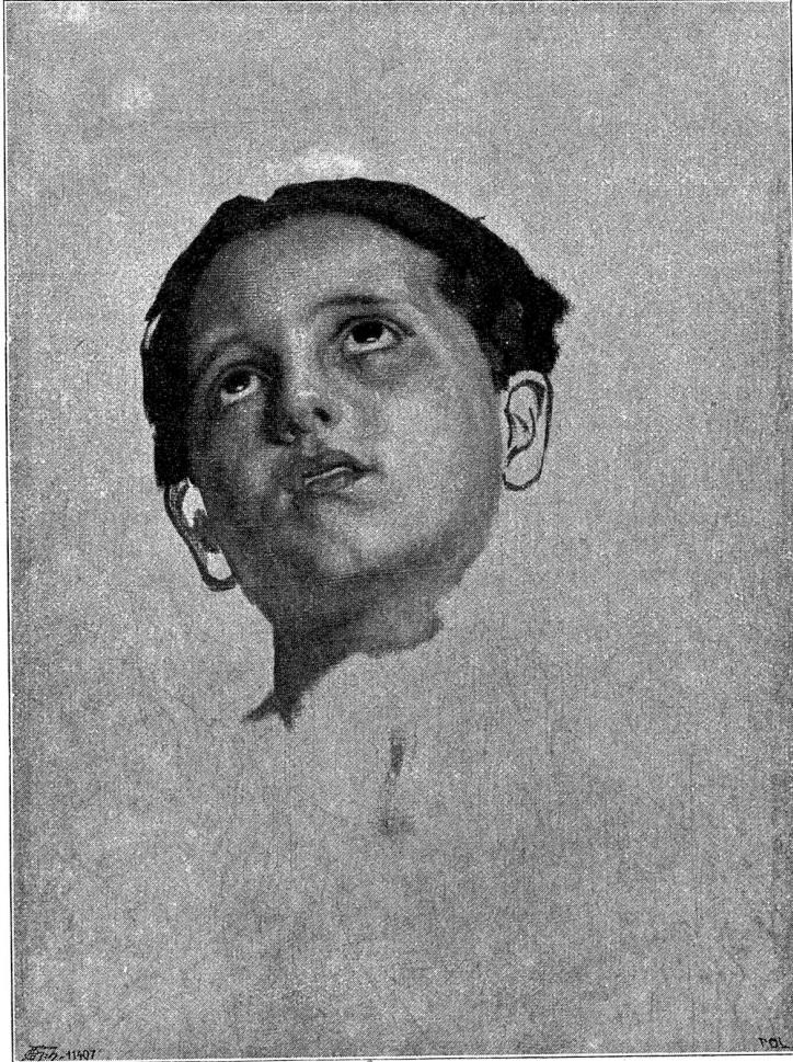
Studienkopf für den „Frühling“.

Viele der Spukgeschichten, die Peterli erzählen gehört, hatten Beziehung zu diesem Lorzentobel. Da war vor Jahren einer auf ganz unerklärliche Weise umgekommen, ein anderer hatte keine gesunde Stunde mehr gehabt nach den schrecklichen Dingen, die er dort erlebt. . . Daß auch er dem einen oder andern dieser Schicksale