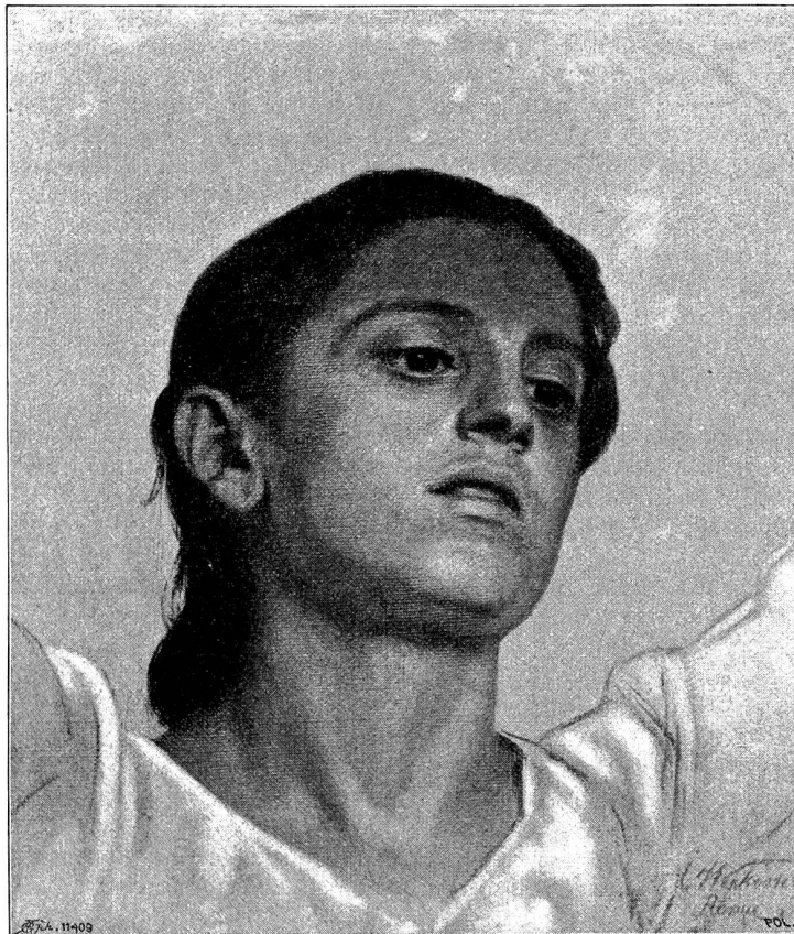
Studienkopf von F. A. Weetesser (Winterthur) für den „Herbst“. Allegorische Figur für eine Veranda des Hrn. Köstli-Beiger in La Tour de Peilz bei Vevey. (Die Studie ist im Besitze des Hrn. Dr. Imhoof-Blumer in Winterthur).

„Ich will ja schon gehen!“ sagte Peterli weinerlich,