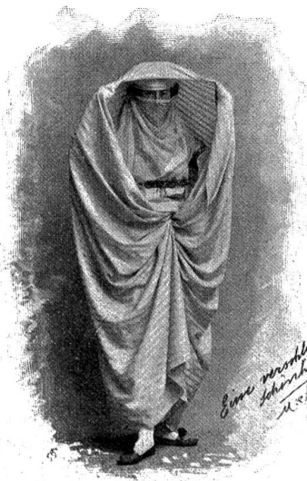
Eine verschleierte Schönheit.

stalten, Männer wie Frauen. Gelegentlich sind reizende Bigaretten eingestreut.