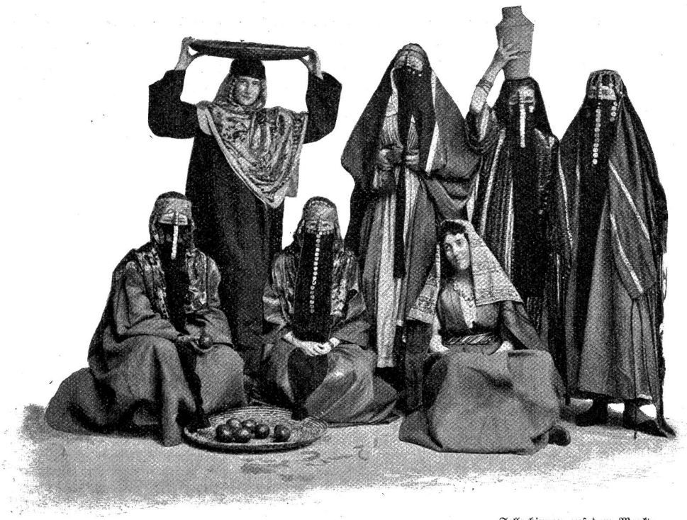
Fellachinnen auf dem Marke.