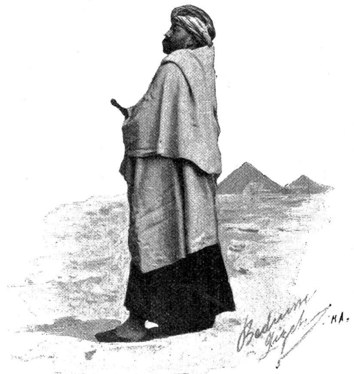
Beduine von Oizeh.