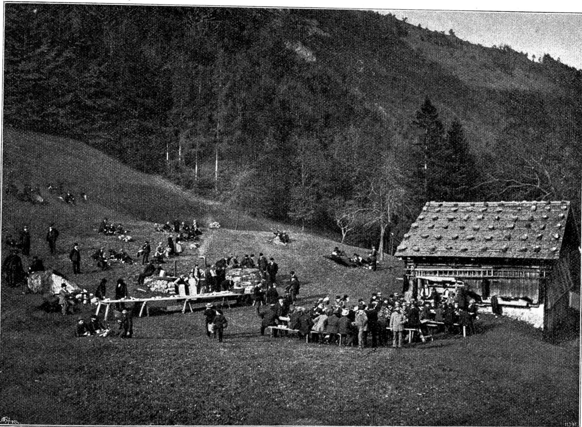
Schützenmahl auf dem Rütli.