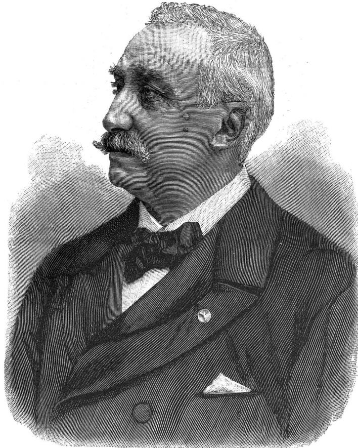
Felix Faure, † 16. Februar,

Heute ist diese reizende Tracht längst verschwunden und das Schweizerische Landesmuseum darf sich dazu beglückwünschen, daß seine Trachtenammlung wenigstens ein vollständiges Kinderkleidchen birgt, das wir zum Vergleiche mit dem Trachtenbilde Ludwig Vogels unserem Texte einreihen. In den schönen Thälern der Neuf, Bünz und kleinen Emme aber suchen wir vergebens nach Erscheinungen, wie sie uns der Künstler so reizend vor die Augen führt; dafür aber pufst überall das Dampfroß, dessen niedlicherer Einfluß selbst nicht ohne Wirkung auf diese im allgemeinen noch sehr an ihren alten Sitten und Gebräuchen hängende Landbevölkerung blieb.