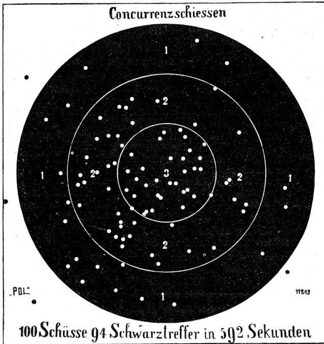
Scheibenbild der vom Meisterschützen C. Stäheli im internationalen Wettkampfe am Schützenfeste auf dem Albisgütl abgegebenen 100 Schüsse.

Bis dahin unerreichte Resultate erzielte der schon genannte C. Stäheli am Ohr- und Freischießen der Schützengesellschaft der Stadt Zürich im Albisgütl. Fig. 1 stellt seine Serienkarte von 50 Schüssen dar, Fig. 3 das Scheibenbild, auf das er schießen