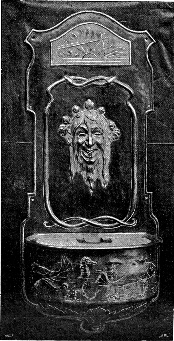
Wandbrunnen, in Kupfer getrieben, in verschiedenfarbiger Patina. Entwurf von E. Zöllner. Erworben vom Gewerbemuseum Bern.

Welch gewaltiger Umschwung hat sich auf diesem Gebiete in den letzten Jahren vollzogen! Nur eine Sache, die ihre tiefe Berechtigung hat, die mit unbedingter Notwendigkeit sich aus dem Alten herausentwickelt hat, nur eine Umwälzung, die, wenn auch meist unbewußt, allgemein herbeigesehnt wurde, kann in so kurzer Zeit so große Erfolge aufweisen.