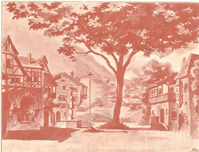
Der Platz zu Altdorf.

Decoraton für die Zell-Aufführung in Hochdorf von Rich. Pagig in Zürich.