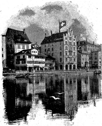
Am Limmatquai in Zürich.

Arbeit! Im Morgengrauen hatte er in den Garten hinuntergespäht; wenn sie schon schliefen, war er durch den Schnee gestapft, um die neugefallenen Schneelasten von den Strohbinden zu schütteln, die er um die Rosenstämmchen gelegt hatte. Er kannte jeden Baum, jeden Strauch. Er hatte schon lange jeden Fußbreit Erde zur Bepflanzung bezeichnet, er trug den Kresse- und Lattichsamen schon in den Rocktaschen umher und als zum erstenmale von dem schönen, breitästigen Birnbaum die Amsel pffiff, war er vor Sonnenaufgang aus dem Bett getaucht und hatte die Läden aufgestoßen und trotz der frostigen Luft in das Dämmerlicht geschaut, hatte den Vogel entdeckt, der auf einem Ast stand und jetzt ein Echo herausgefordert hatte, das weither vom Schornstein des Pfundhauses herüberklang. Auch jetzt lief ein Goldschnabel vor ihm über den Weg und huschte in das Dunkel unter den Tännchen.