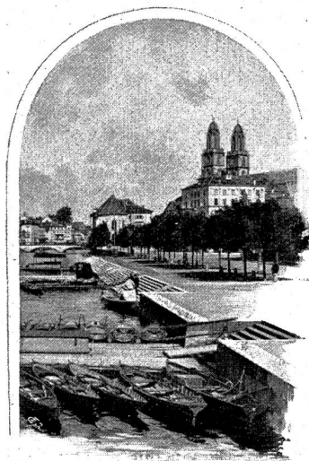
Am Sonnenquai in Zürich.

„Ja, sehr lieb, und er hat sie lieb und sie ihn! Alle Wetter, die Konjugation kann ich auswendig! Aber heiraten, Hertha, heiraten, bedenk', das ist doch ein anderes Ding! Du verstehst mich schon.“