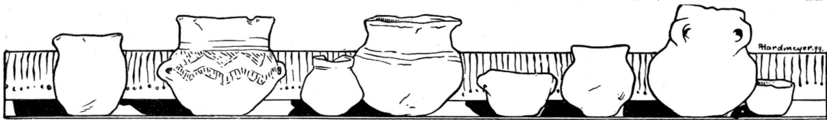
Töpferprodukte aus Pfahlbauten der Schweiz.