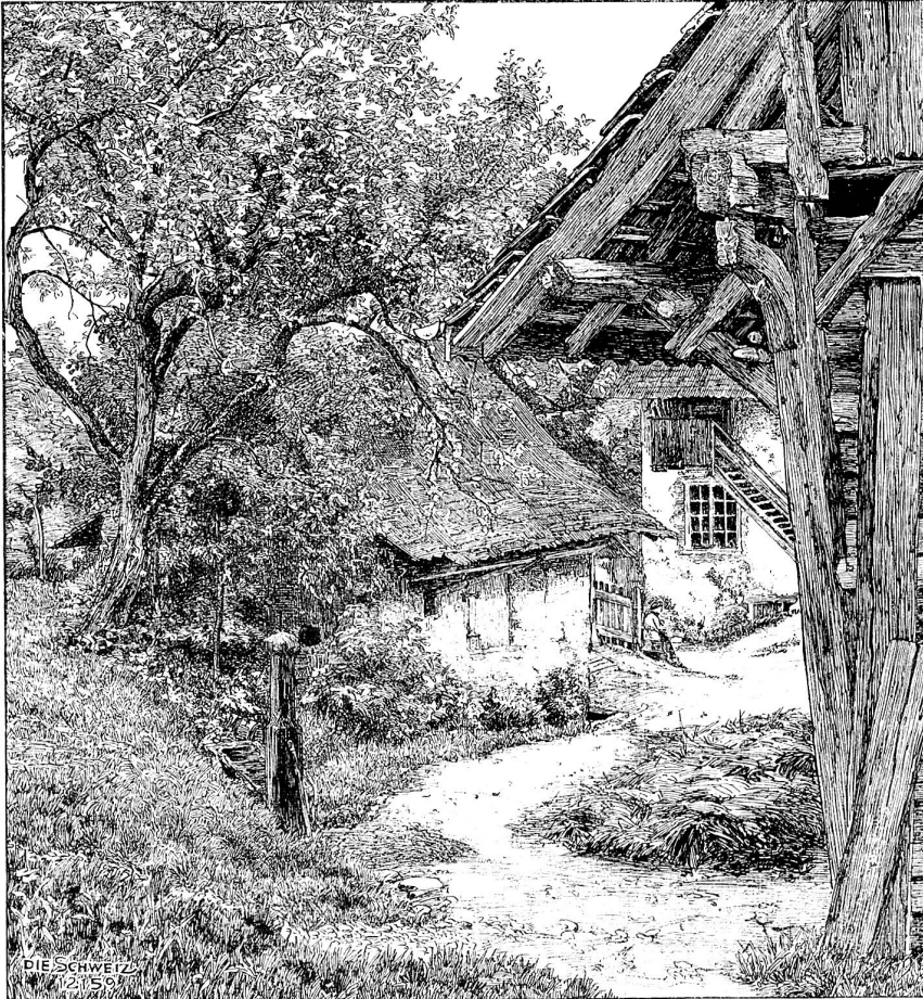
Motiv aus dem Wehuthal. Originalzeichnung von G. Tobler, Zürich.

Waldeskronen hereindringt, von den Nestern zerfetzt wird und doch keck und frohlockend auf die Erde springt, hinab zu der Quelle dort, die wie schäumender Wein aus dem Boden sprudelt und sich zu einem Teiche breitet. Julia liebte den walddumrahnten Spiegel. Wie oft hatte sie darin die Bläue des Himmels beguckt und die Wolken, die darüber wandelten und die Eichen und