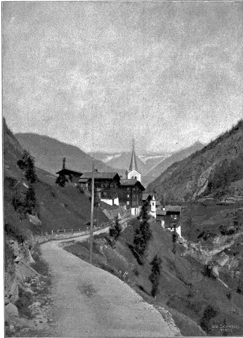
Eipfen im Saasthal.

Seine Kugeln rissen ganze Buckel aus dem Rückenpanzer weg, und überhaupt war der „Setan“, als wir ihn zuletzt tot aufschickten, derartig zugerichtet, daß die „Haut“ nichts mehr wert war. Er maß beinahe 7 Meter, gehörte also noch nicht einmal zu den größten, denn unten in Panai waren Krokodile von 8 Metern keine Seltenheit, und es wird sogar von noch riesigeren berichtet. So ein Krokodil von 7 bis 8 Metern ist schon ein ganz gewaltiger Geselle und erinnert lebhaft an vorjüngtliche Saurier, deren ungeheure Knochen wir in den Erdschichten jener weit