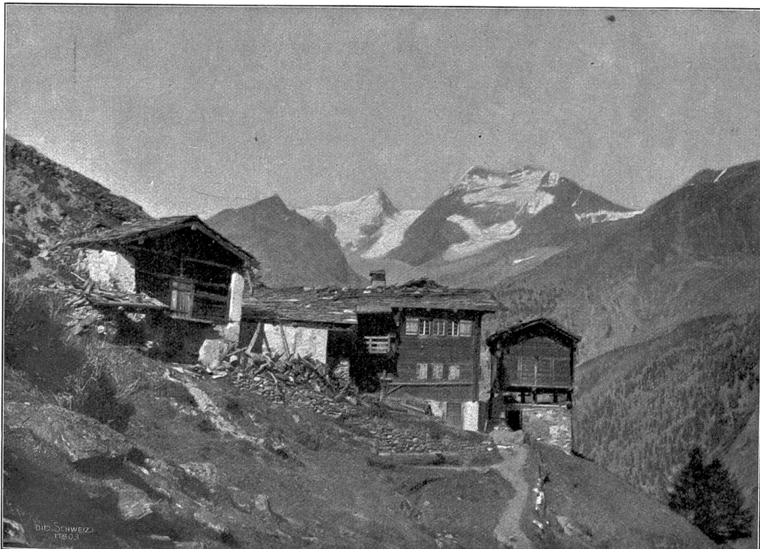
Honeggen bei Saas-Fee.