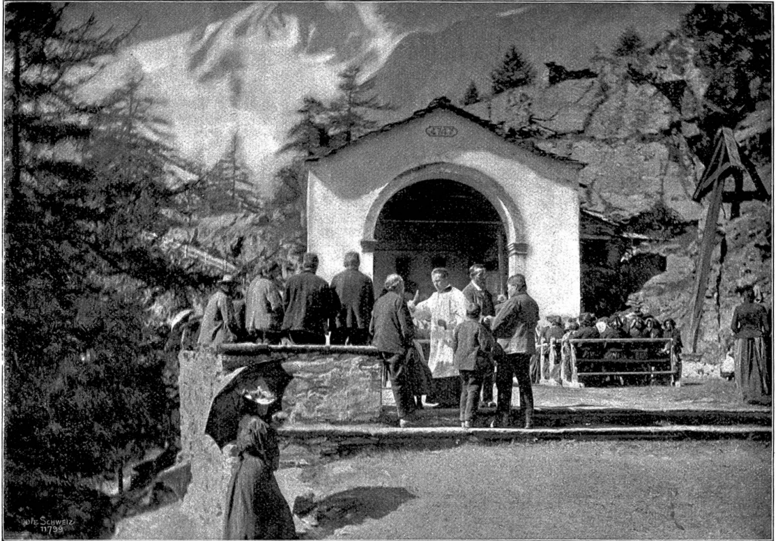
Gottesdienst bei Saas-Fee.