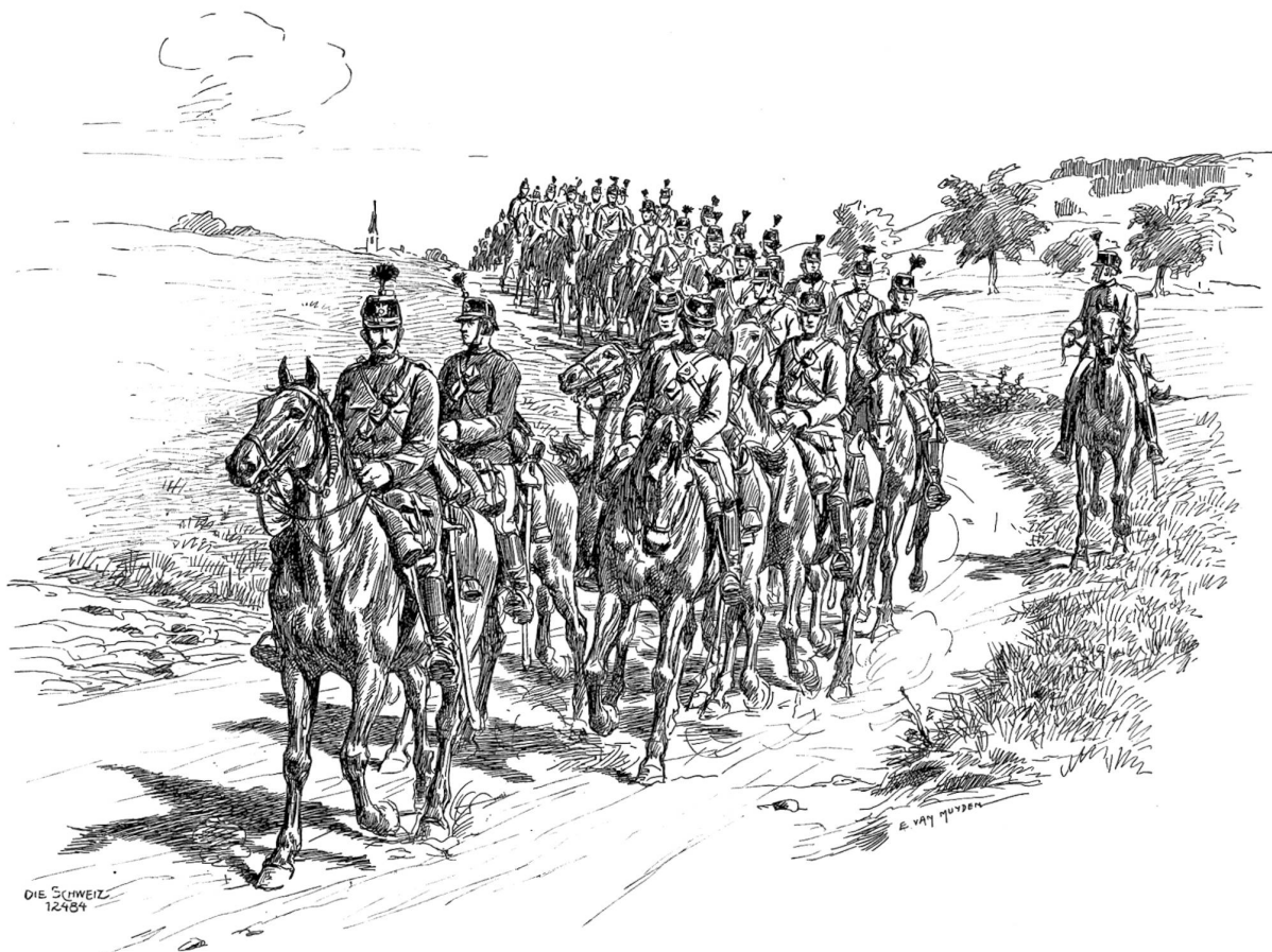
Schweizerische Dragoner auf dem Marsche.

unserer Ansicht nach mit Unrecht, weil es den Genuß der Lektüre nicht zu schmälern vermag.