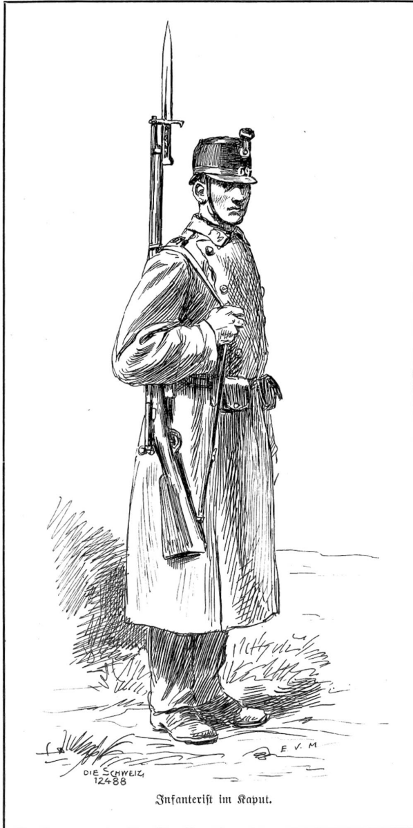
Infanterist im Kaput.

den Namen desselben, noch auf die Straße. — Laßt uns sehen, welche Straße schlugen Sie ein, als Sie den Bahnhof verließen? — Ich wählte die und die Straße, gelangte auf einen Platz, und wandte mich links. — Nun nannten sie mir verschiedene Restaurationen, ihre Aushängeschilder, irgend eine Eigentümlichkeit dieser Lokale; nichts paßte. — Und doch . . . eine derselben muß es sein; welche denn? Und sie besprachen sich darüber, es konnte die eine, es konnte die andere sein; vielleicht entsinne ich mich irgend eines Umstandes nicht. — Sind Sie ganz sicher, links gegangen zu sein? — Sehr sicher. — Und wie lange sind Sie ungefähr gegangen? Sah das Wirtshaus vornen ungefähr so und so aus? Sie sind in einen großen Saal im ersten Stocke hinaufgestiegen, haben Sie gesagt? — Ja, aber meine Angaben stimmten nicht. Sie mühten sich ab, wie an einem Rebus. Sie wollten um jeden Preis die Sache herauskriegen. Vielleicht haben wir uns über den Ausgangspunkt nicht verstanden. — Wie war aber der Platz, von dem Sie ausgegangen sind? Gernern Sie sich an etwas Besonderes? — Und das Gespräch fuhr in dieser Weise ohne Erfolg fort, zu ihrem sichtlichen Verdrusse. — Oh, schließlich — sagte Verne, — wenn Sie ihn sehen, so würden Sie ihn wiedererkennen, nicht wahr? — Ohne Zweifel. — Nun denn,