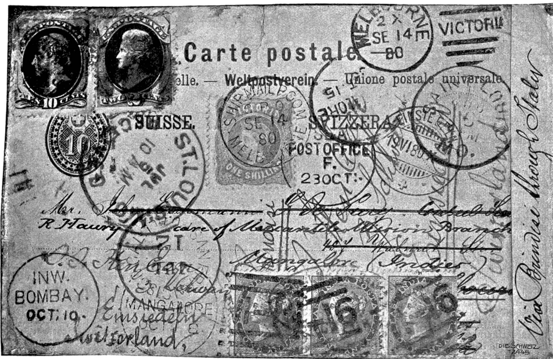
Reisen um die Welt.

„Zur billigen Charlotte, Straße Vivienne Nr. 1328, berühmt durch ihre Hosenkнопfe, Fabrikmarke und Patent Bayard.“