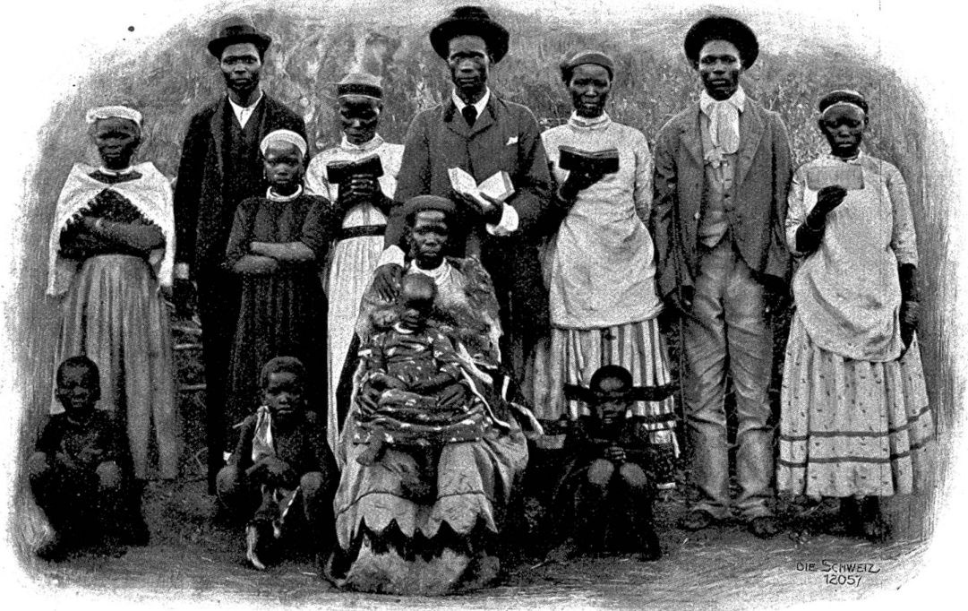
DIE SCHWEIZ 12057

Unflüchlich der grausamen Szenen, die laut Zeitungsmeldungen Engländer und Franzosen in letzter Zeit im dunklen Erdteile wieder verübten, kann man wohl Seumes Worte anwenden auf die gebildeten Europäer: „Seht, wir Wilde sind doch bessere Menschen!“ Die Kaffern, die unsere Kultur noch nicht kennen, mögen wohl grausam und heimtückisch, diebisch sein. Von denen aber, die Christ geworden sind, weiß man meist nur Gutes zu berichten. Ja! Viele sollen sogar bessere Christen sein als die zum Christentume aufgezogenen Weißen, die sich so gern für gut und besser als die Schwarzen glauben. Es muß einen eigentümlichen Eindruck auf den Europäer machen, wenn er in einem Kraal die kirchlichen Lieber seiner Religion von Schwarzen singen hört mit einer Begelsterung und Hingabe, die er selber längst verloren hat auf der Jagd nach Geld