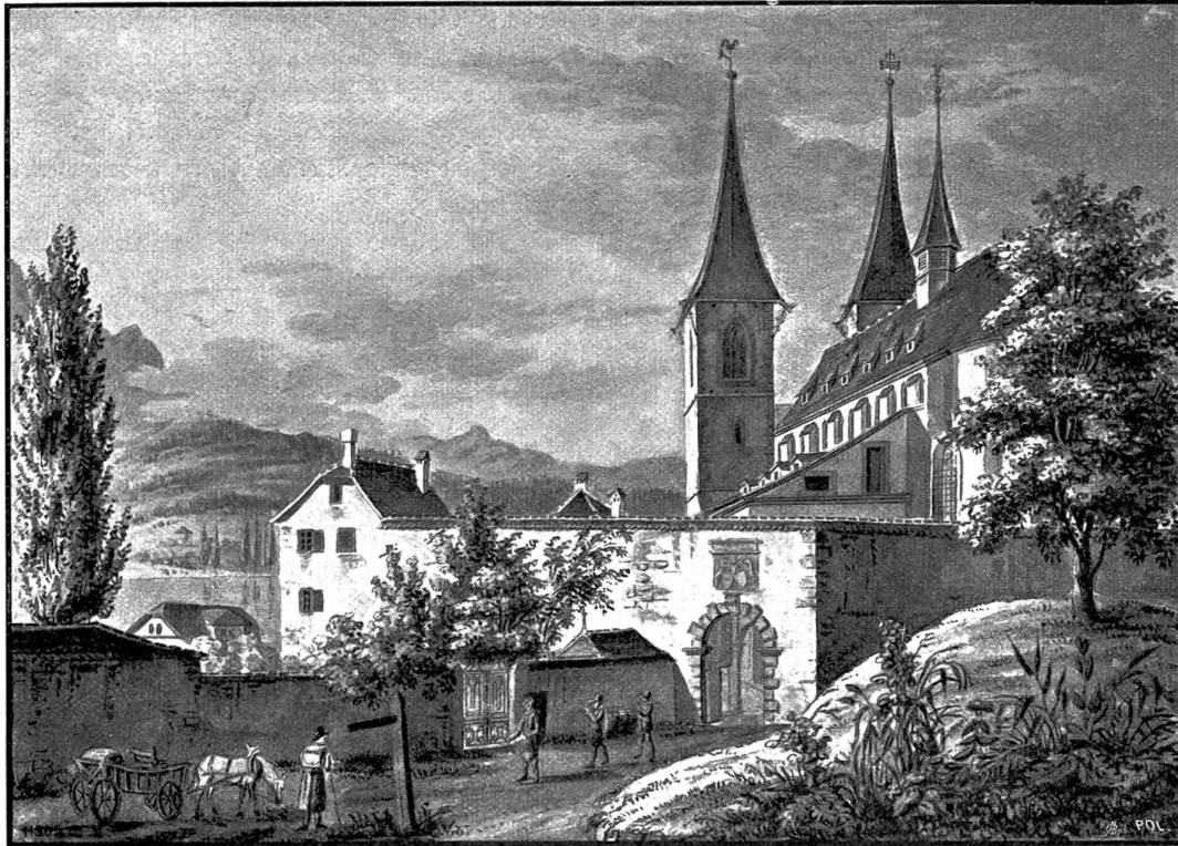
Hofkirche mit Zinggenthor in Luzern. Sepiazeichnung von G. u. L. Schultheß (ca. 1850/54).

Und die Mutter darauf: „Ich werde dir gleich was aufspielen! Wart' nur!“ Und nun machte sie oft Musik auf seinem Rücken mit dem Schaumlöffel. Der Junge schrie, versprach, niemals mehr auf die Stimmen zu hören, dachte aber doch fort daran, daß dort im Walde etwas gespielt hatte . . . Wer? — Wußte er's denn? . . . Die Tannen, Buchen, Birken, Pizrole — alles sang! . . . Der ganze Wald, und basta!