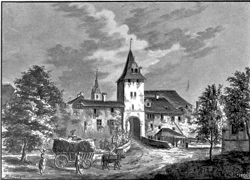
Sempach: Luzernerthor mit Wächterturn. Sepiazeichnung von E. u. L. Schultheß (ca. 1850/54).

Ach, was hätte er darum gegeben, eine Geige zu besitzen, die da sanft spielte: „Wir wollen essen, wollen trinken — Und wollen tanzend fröhlich singen!“ . . . Solche singende Brettchen? . . . Bah, woher sie kriegen? . . . Wo verfertigt man sie? . . . Ja, wenn sie ihm wenigstens erlaubten, so was ein-