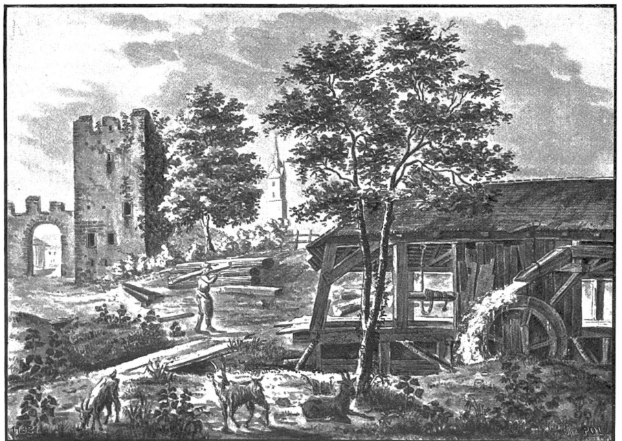
Herzenturm — ehemals Schloß des Grafen von Habsburg in Sempach. Sepiazeichnung von G. u. L. Schultheß (ca. 1850/54).

und eben das Spiel des Windes auf der Holzgabel belauschte . . . Sofort gürtete er den Riemen ab und verschaffte ihm ein gutes Denkzeichen. Doch was half dies? Die Leute nannten ihn: Janko, der Musikant! . . . Im Frühling, da konnte er ins Freie hinauslaufen, um sich an rauschenden Bache Hirtenflöten zu schnitzen. Bei Nacht, wenn die Frösche zu quaken, die Wachtelkönige auf den Wiesen zu schnalzen, die Rohrdommeln im Tau zu brummen ansingen, wenn die Hähne hinter den Zäunen krächten: dann konnte er nicht schlafen, sondern horchte nur, und horchte — und Gott allein mag's wissen, was für eine Musik er sogar hier heraus-