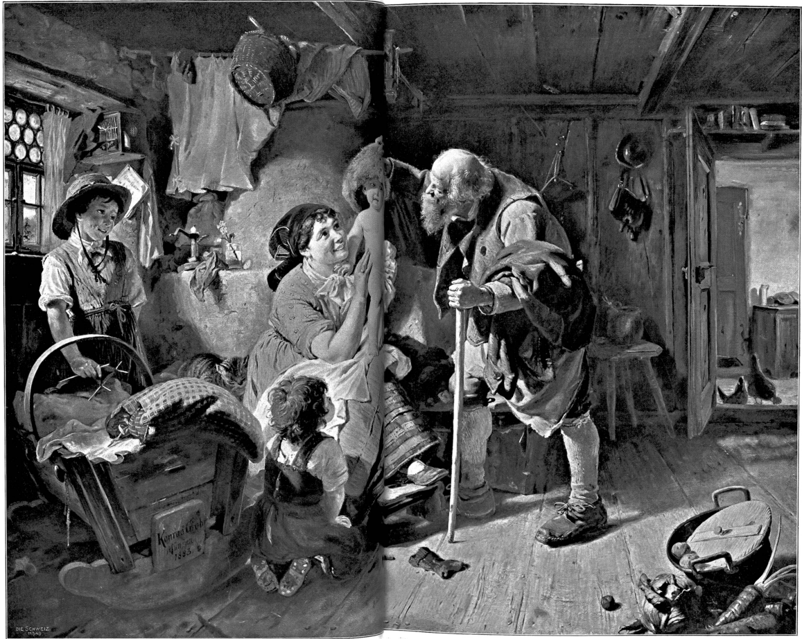
Die Melzmilch. Gemälde von Konrad Grieb.