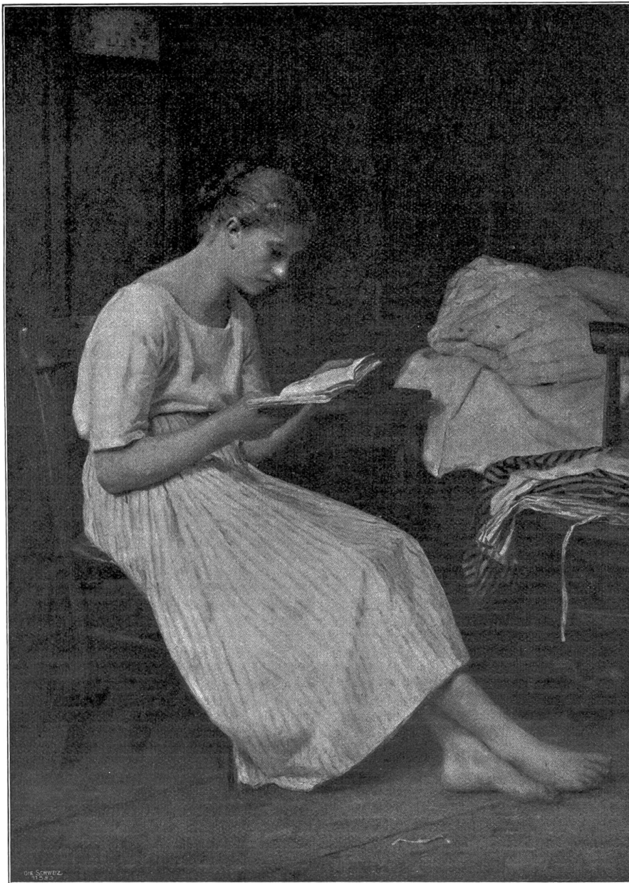
Eine Gotthelf-Leserin. Gemälde von Albert Anker.

Also die Sache ist so: Ich ließ mich von meinen Freunden Du Meril — Leute, die du nicht kennst — verleiten, einige Tage zu ihnen nach Brighton zu kommen. Herr Du Meril, ein echter Pariser — die Noblesse de Robe ist sehr klein, dafür das Vermögen groß — ist ein alter Freund meines Vaters, herzlich, gutmütig, heiter, kennt mich von Geburt an und hat mich sehr lieb. Vor einigen Jahren entdeckte er England, faßte eine Leidenschaft dafür und bringt seitdem regelmäßig die letzten Monate des Jahres hier zu, wo er alles prach-