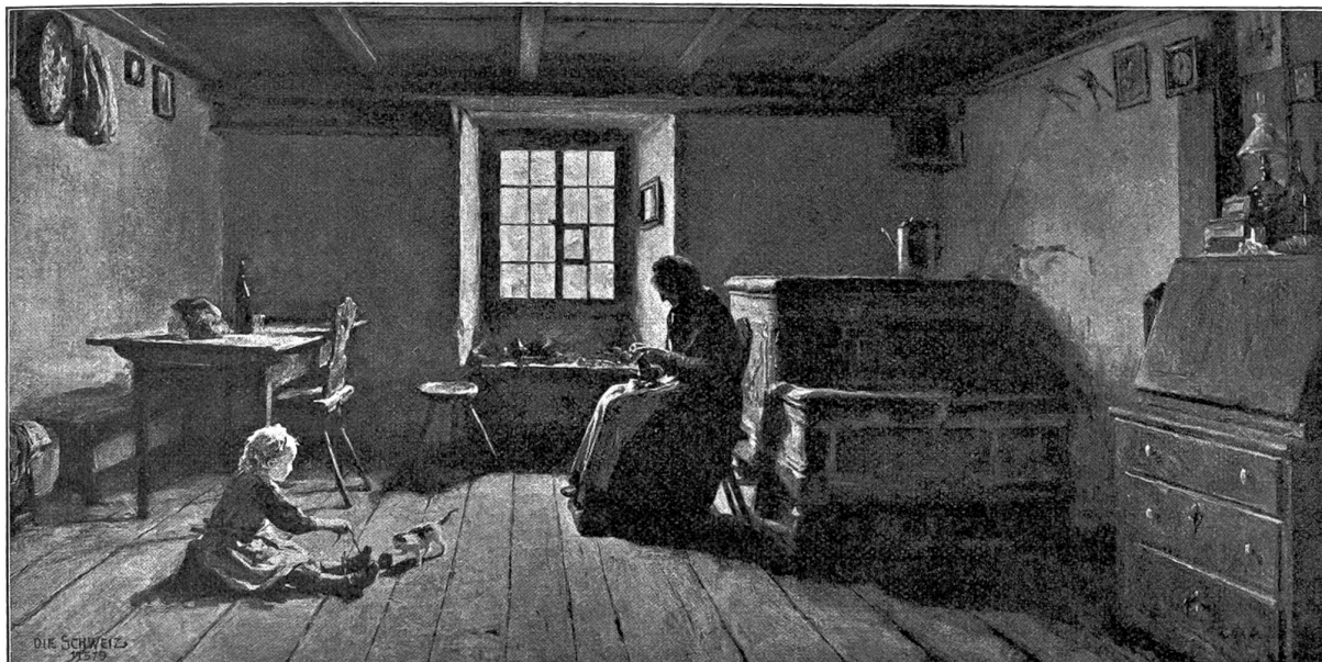
Bauernstube. Gemälde von Albert Anker.

gögen kann. Ich vermute, daß er sich im tiefsten Innern schrecklich langweilt; darum hat er mich wahrscheinlich so überaus dringend eingeladen.