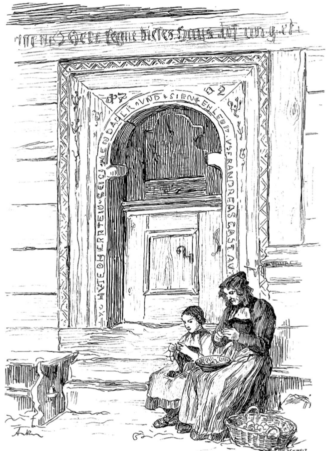
Federzeichnung von Albert Anker.

„Sie sagten mir jüngst... Sie hätten schon geliebt... Warum anvertrauten Sie mir das? Ich weiß es nicht. Lassen Sie mich heute nur das fragen: Vermögen Sie noch zu lieben?“