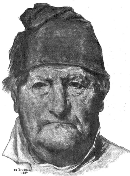
Studentenkopf. Von Albert Anker.

Miß Iilith zählt dreiundzwanzig Jahre; sie hat das reine, regelmäßige Gesicht, das Burne-Jones so liebt, und welches in der That der klassische Typus ihrer Rasse ist: blaue Augen, blondes Haar, matter Teint. Ohne Zweifel hältst du nach diesen schlichten Worten — die aber die einzigen richtigen sind — ihr Antlitz für höchst alltäglich, während es im Gegenteil so ausdrucksvoll als möglich ist. Wohlverstanden: „ausdrucksvoll“ will hier nicht ein leidenschaftlich bewegtes oder ein Gesicht bezeichnen, das die Anomalie des Herzens, innere Aufregung, die Beweglichkeit eines verstorbenen Gemütes verrät. O nein, mein Gott! Wie soll man dies gehaltene Wesen schildern? Die Harmonie der Bewegung, der Gesten, der Stimme und Züge drückt mit ergreifender Macht einen ruhigen, einen — im olympischen Sinn des Worts — schönen Gemütszustand aus; denn, nicht wahr, es gibt wie eine physische, so auch eine moralische Schönheit, und wo anders ist diese zu suchen, als im Gleichmaß und der Schlichtheit des Charakters? Begreiffst du nun den mächtigen Reiz, der noch vermehrt wird durch die den jungen Engländerinnen eigenen ungezwungenen Manieren, den Iilith auf mich ausübt? Um ihr Bild zu vervollständigen, füge ich noch bei, daß sie sich gerne nach ästhetischer Mode kleidet, sei es, daß sie fühlt, dieser alte Schnitt und die verblassten Farben passen zu ihr; sei es, daß sie wie die