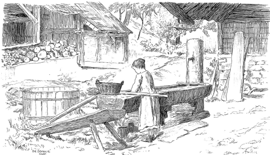
Am Brunnen. Federzeichnung von Albert Anker.

„Leben Sie wohl! Glückliche Reise!“ Auch die Hotelportiers sagen dir so viel, wenn du ihnen, nachdem du deine Rechnung bezahlt, noch ein Trinkgeld gibst, und ebenso die Unbekannten, mit denen du auf der Eisenbahnfahrt geplaudert, wenn du sie verläßt, um in einen andern Zug zu steigen. Was hätte ich ihr nicht alles sagen mögen? Und wer weiß? Sie vielleicht auch mir. . . . Warum also solch ein Abstand zwischen dem Herzen und der Sprache? Warum ist das, was wir sagen, so verschieden von dem, was wir empfinden? Warum ist das Leben so dumm, daß tausenderlei in uns vorgeht, das sich nicht hervor- traut, und daß wir grausamerweise leiden um Ursachen, die wir nicht kennen? Wen hat sie geliebt? Und warum will sie nicht mehr lieben? Weshalb reise ich weg? Ist das Glück an uns vorübergegangen? Nun bin ich in meine