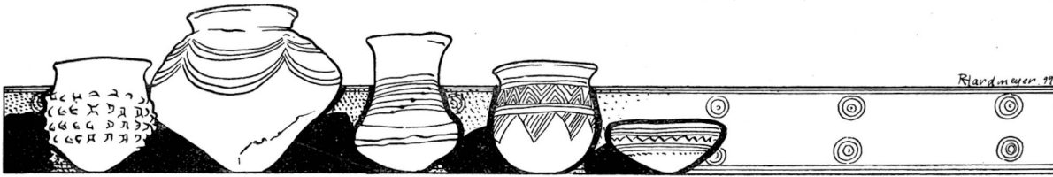
Tongefäße und Verzierungen aus Pfahlbauten.

einander, fing an zu schimpfen und über Gott und Welt zu fluchen und verließ das Windlochhäuschen. Der Hannes aber stellte sich mitten in die Stube und brüllte: „Und jetzt, Maitli, mach', daß du auf den Laubsack kommst! Mußt nicht meinen, weil ich dem unheimlichen Schleicher da den Weg gezeigt habe, nun könne das Zusammenhocken und Karlichäpserlen mit dem Wylsel wieder anfangen. Hab' ich früher von dem nichts wissen wollen, so soll er mir jetzt erst recht nicht unter die Augen kommen, denn wer weiß, ob der Fränzel oder