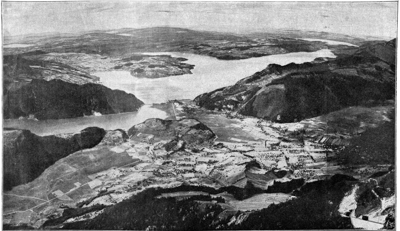
Vierwaldstättersee, Bürgenstock, Luzern und die Nordschweiz vom Stanserhorn aus.

Sempachersee Jura Aargauersee Kyllmattlersee Luzern Stansstad Jura Bürgenstock Zugersee Stans Glanzeggsee Ruhn