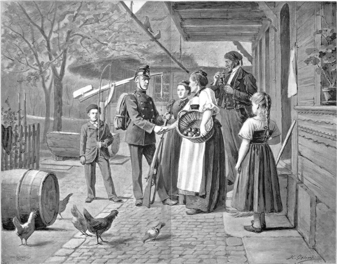
Bilder aus dem Leben eines Kleinbauern im Kanton Bern: Der Sohn kehrt aus der Infanterie-Rekrutenschule heim. Für „Die Schweiz“ gezeichnet von Karl Gehel, Münstereibuchsee.