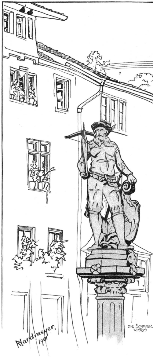
Der Tüllbrunnen in Schaffhausen. Originalzeichnung von H. Klandmayer, Küssnacht.

neben seinem Feuer stehen, das er langsam und wie spielend schürte, während seine Augen heimlich an ihr hafteten. Darüber geschah es, daß die zwei, im Dienst derselben hohen Sache sich wissend, sich wie durch unsichtbare Bande verbunden erschienen und ohne Wort, ohne je einander zu begegnen, heimlich eines des andern gerne und voll herzlichen Wohlgefallens gedachte.