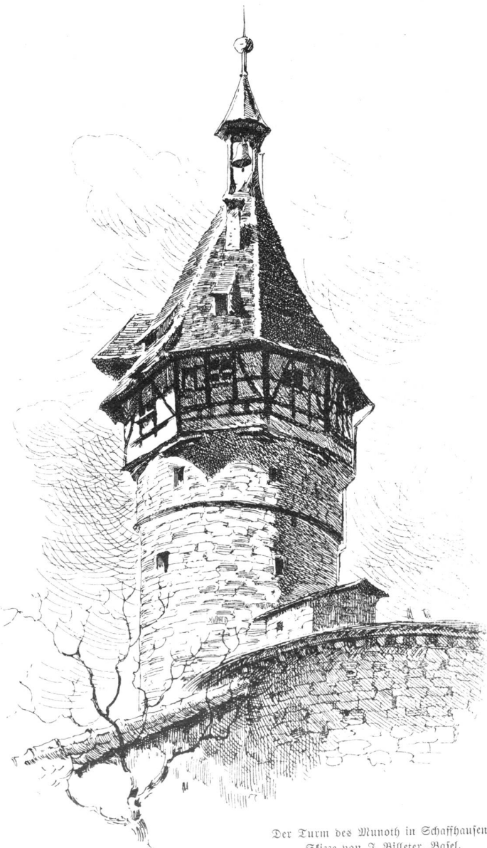
Der Turm des Munoth in Schaffhausen. Skizze von J. Billeter, Basel.

Der Pfarrherr fühlte ein mächtiges Mitleid; aber er war von ihrer Beichte nicht überrascht. Als er sie