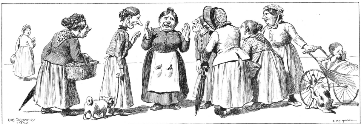
„Wie kann man auch so viel Geld für ein Fest wegwerfen. Wenn ich allein auf der Welt wäre, würde ich alle Festzüge verbieten.“