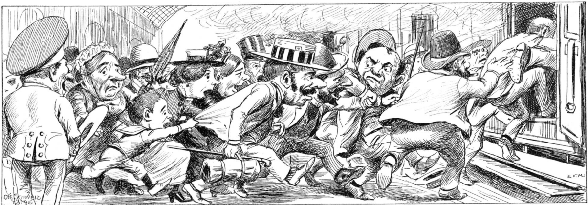
„Nach Immedinge, Singe, Thahnge, Schaffhaufe! — Festschbefeher hinte ei'fsteige!“