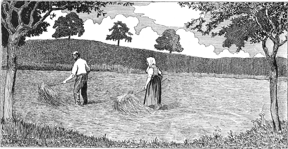
Heuernte. Originalzeichnung von F. Widmann, Mischlikon.