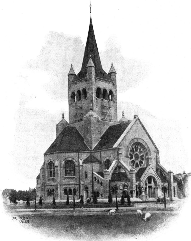
DIE SCHWEIZ 13126

Die Menschen kamen aus dunklen Schlafkammern und traulichen Alkoven dicht umschlungen heraus in stille Gärten, — stumm und glücklich.