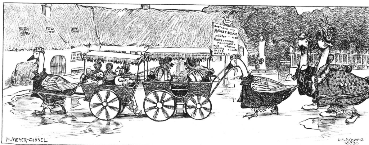
Die Landpartie. Originalzeichnung von H. Meyer-Cassel, Zürich.