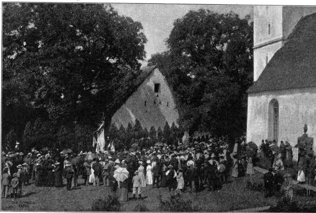
Die Einweihung des franzosendenkmals in Birr.

Stadt zeigen. Ich wollte jetzt sehen, ob er mir gefalle; es sei nachher Zeit genug mit dem Ältesten zu sprechen. Die Glaubensbrüder gingen mir aber nicht vom Halse und unter ihren Augen wurde ich mit großer Freundlichkeit und Zuvorkommenheit von der Herrschaft aufgenommen. Die Leute er suchten mich, sogleich dazubleiben; denn sie haben mich sehr nötig; was mir natürlich sehr lieb war.