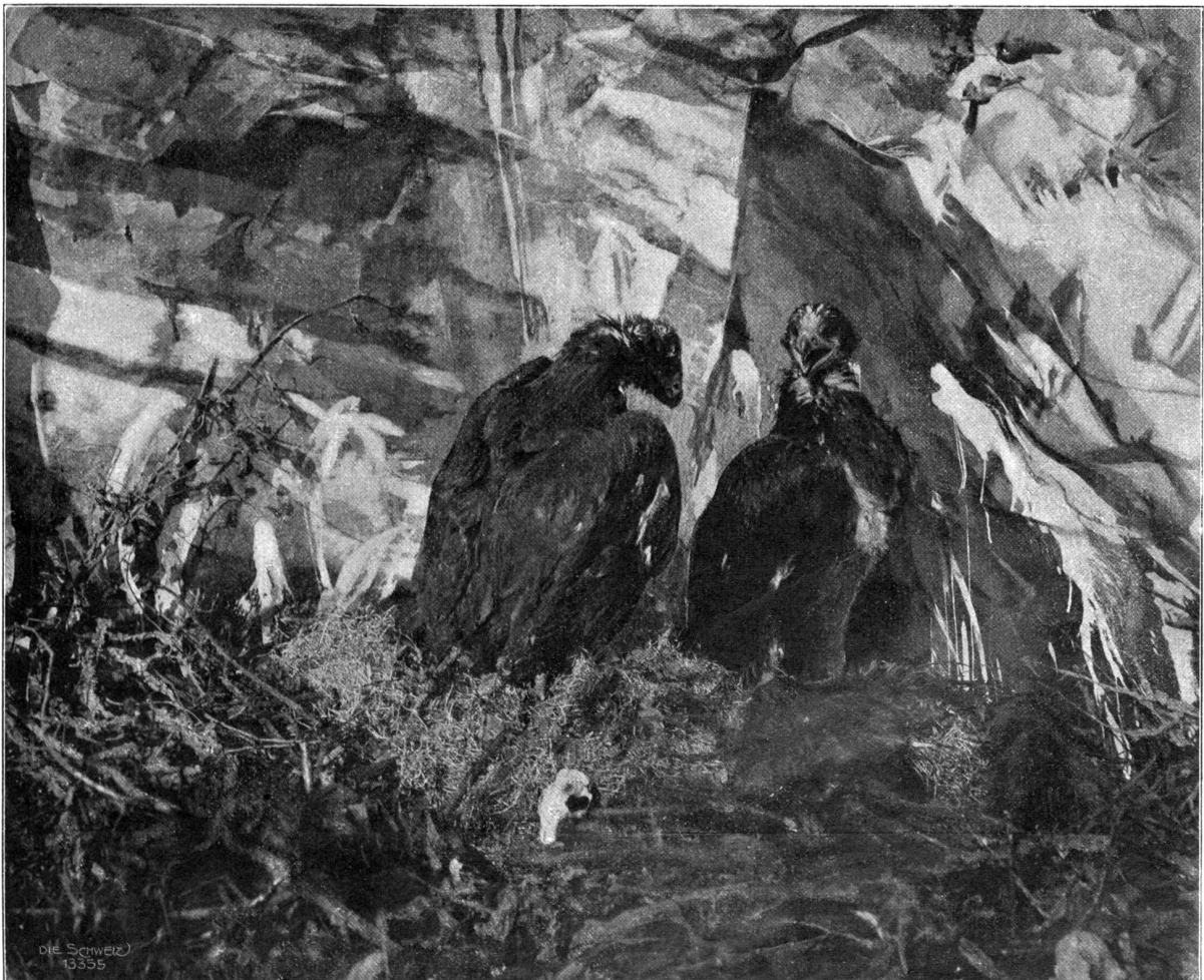
Die jungen Adler im Horste.