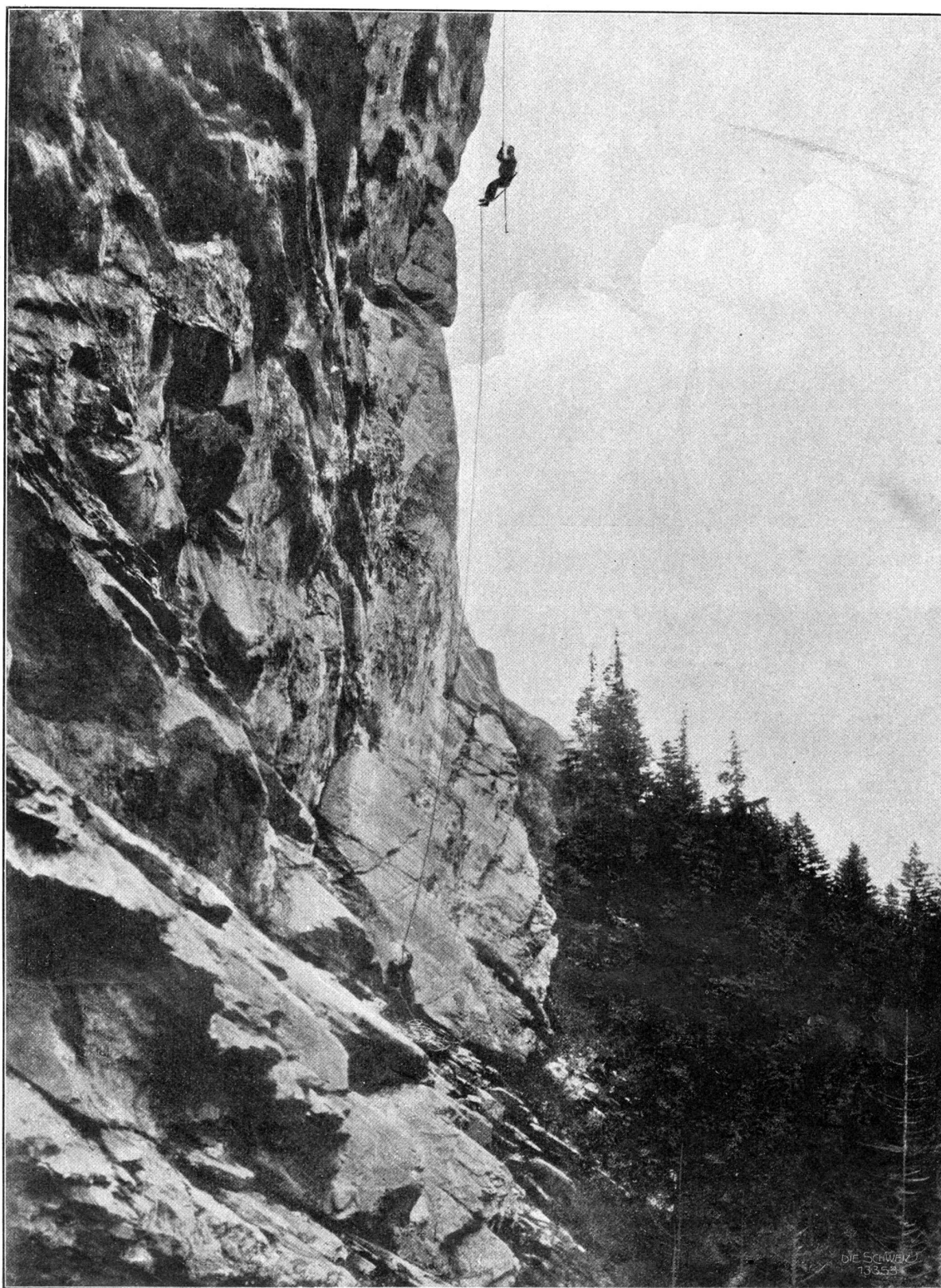
Gefährliche Fahrt zum Adlerhorst.