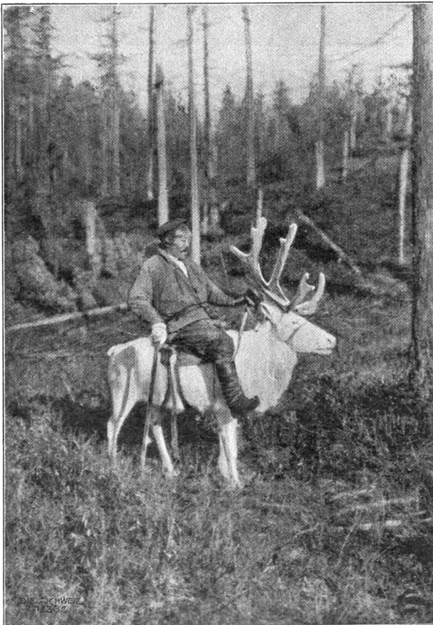
Tunguse auf dem Rentier.

'S ist nur ein Blümchen, damit wir's betreuen, 'S ist nur ein Wesen, zum lieben und freuen, 'S ist nur ein Kindchen, niemals in Ruh, Klein, doch wie lieb uns, weißt Gott, wohl nur du!