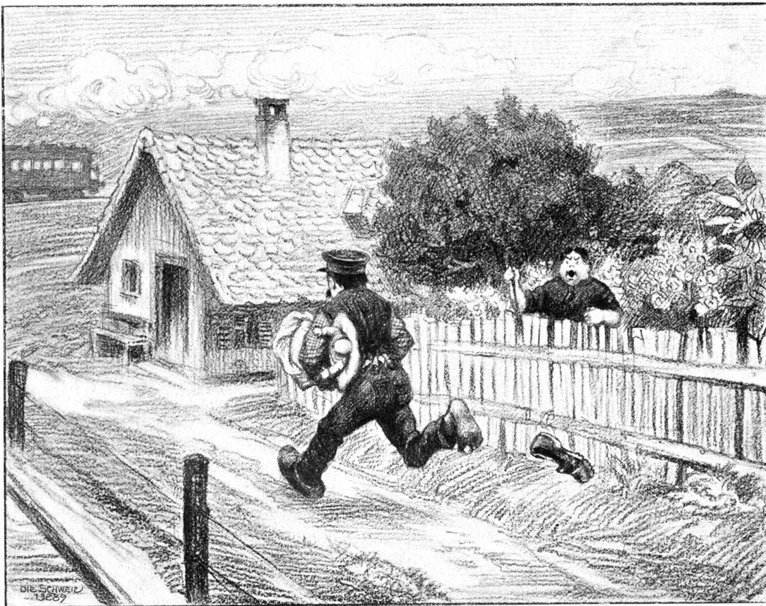
„Der Schnellzug kommt!“ II. (H. Meyer-Cassel in Zürich).

Reiskörnern und um diese Zeit haben Jagdausflüge des Morgens oder des Abends in die Nähe der Felder guten Erfolg. Die Kröpfe der mannigfachen Taubenarten, welche zum Schutz kommen, sind oft zum Plagen voll mit Reis. Mit der Saat ist aber die Arbeit für den Malayan noch nicht beendet. Der fleißige Mann entfernt das sich überall breit machende Unkraut und der Fauler erstellt mindestens einen leichten Zaun um seinen Besitz, um marodierenden Hirschen und Schweinen den Eingang zu verwehren. Namentlich letztere sind für den Malayan eine schwere Plage und vor der Reisernte wird man in allen Dörfern um Schießpulver angebettelt. Gelegentlich brechen Elephanten in den Ladang und was sie nicht auffressen, zertampfen sie mit ihren mächtigen Füßen. Aber auch Scharen von Tauben und kleinern Vögeln wollen ihren Anteil haben. Um sich einigermaßen gegen dieselben zu schützen, werden ähnlich wie bei uns, Vogelscheuchen aus alten Kleidern aufge-