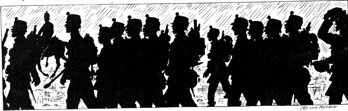
„Soldatenleben und das heißt lustig sein.“

wildflackernden Wellgrub im Herzen: „Noch eine kurze Reihe von Nächten,“ machte er für sich, — „dann schlüpft hier ein Vogel durch das Gestäube, so schwarz wie ein Zwergtannchen im Sommerschnee und so flink und geräuschlos, wie ein einsamer Wolkenschatten über's Firnfeld. Und ich lauere ihm auf: Holdi, Lachdrossel! Im Hui hasche ich den Vogel und fort mit ihm in's Laubnest. Ob dann Ziu oder der bleiche . . .“ Er verstummte und horchte auf. Ein seltsames Summen war erst in der Luft, als hielten im einsamen Thal schlupf vor ihm unsichtbare Berggeister ein Ding, dann ward daraus ein rauschendes Tosen. „Der Bach geht hoch am Rauschen an,“ rebete Martin, der Truht hinter ihm, — „am End kommen wir nicht einmal hinüber und müssen bis morgen im Walde lagern, bis der abgelassene Wildbling ausgetobt hat. Hörst, Nichilo, wie's rauscht und thut? — hab schon gedacht, der Graben könnte uns noch den Weg versperren, wie ich die letzte Nacht so über die Dächer wettern und tschättern hörte, als regnete es Stierenschwänze und Lannzapfen.