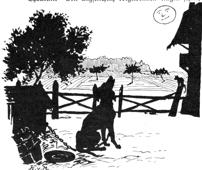
„Guter Mond, du gehst so stille.“