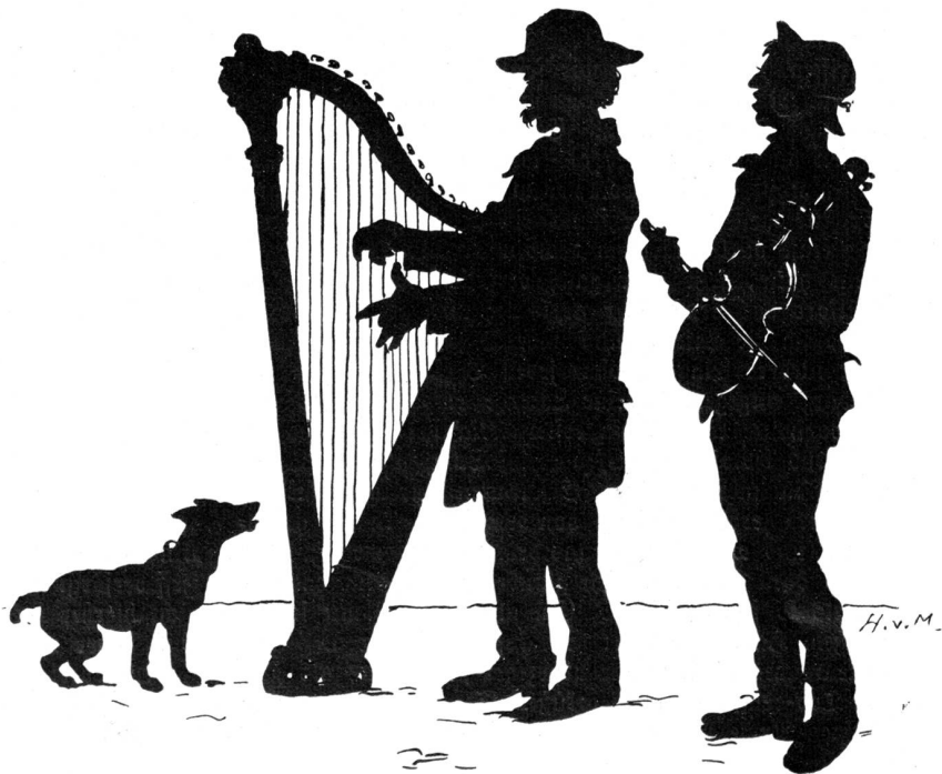
Der Alte mit der Harfe.

„Ich will dir nur sagen, daß ich hinuntergehe und nachsehe, was dem armen Tier fehlt.“