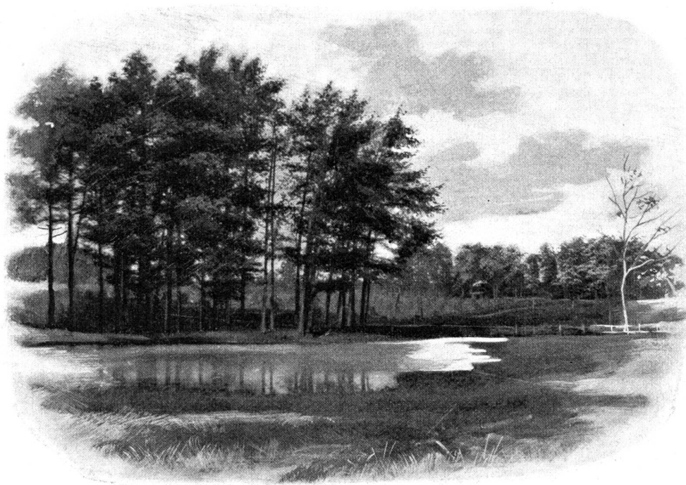
Schwarzeichen am Donaldson-Lake bei Elizabethtown, Kentucky.