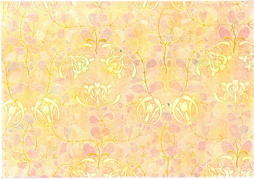
Geißblatt, Flächenmuster. Originalkomposition von A. Lamvert, Berlin.

zwei Schillings, im Parket, ganz nah bei der Bühne. Diesmal wollte sie nicht sparen; sie wollte in nächster Nähe sein, wenn ihr Will vorbeiziehen würde. Die kleine Kitty vom Hause Walton & Cie., verschüchtert durch die Blicke der Männer, schlich zu ihrem Plazet hin und duckte sich. Dieser Saal mit den goldstrotzenden Wänden bedrückte sie.