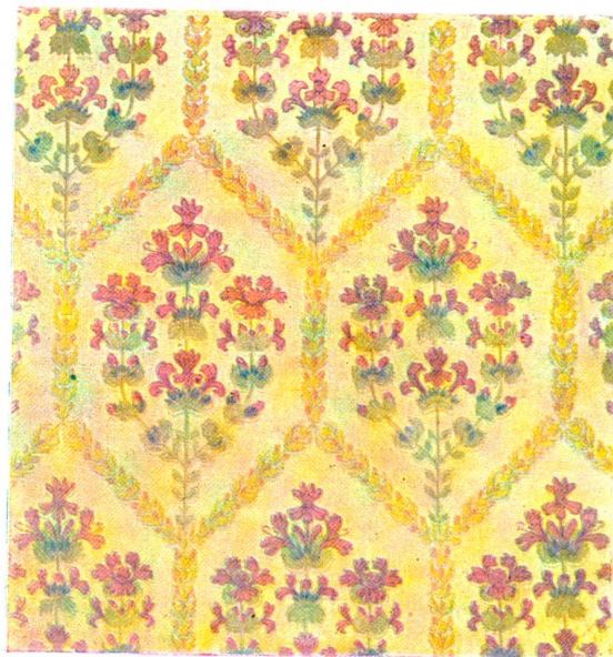
Taubneffel, Flächenmuster. Originalzeichnung von Hans Koller, Stawil.

Er war ein ehrlicher Kerl aus dem Northumberland, Schmied von Beruf, den sie letztes Jahr in einer Arbeiterversammlung kennen gelernt. Kittys Sanftmut