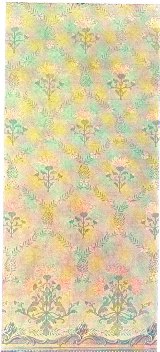
Chrysanthemum, Flächenmuster. Originalkomposition von G. Schwendemann, Stawil.