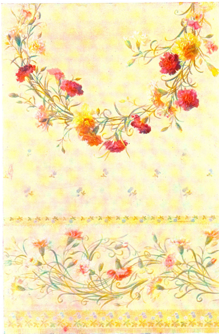
Teifen. Nach einem Bordentwurf von J. Stauffacher, St. Gallen, gemalt von G. Schwendemann, Flawil.

Kitty verlangte schein am Schalter einen Platz zu