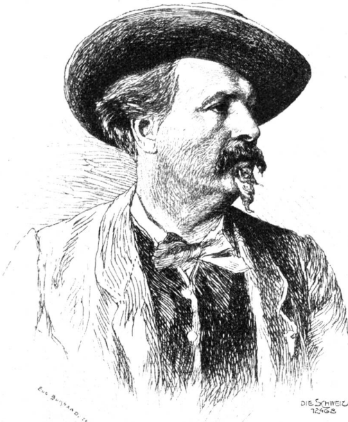
Porträt des provençalischen Dichters Mistral. Nach einer Radierung von E. Burnand.

„Meinst du nicht, ich dürfe das Kind zu uns hinübernehmen?“ fragte Anne Marie ihren Mann. „Es wäre ja auch meine Pflicht“ — mein Recht, fiel ihr nicht ein zu jagen — „und meine ganze Freude.“