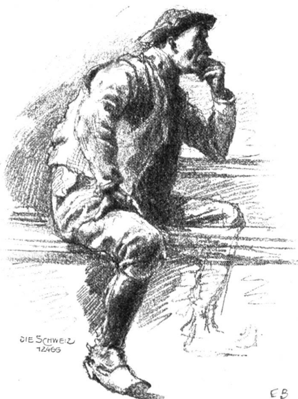
Bauer aus der Provence. Bleistiftstudie von Eugen Burnand.