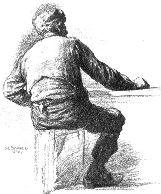
Bauer aus der Provence. Bleistiftstudie von Eugen Burnand.

Bei der Abendmilch war das Gretlein, dessen Gesicht durch Schwamm und Seife seine natürliche rosige Farbe zurückgewonnen hatte, wieder guter Dinge und zwitscherte wie die Spazierer draußen, die sich in dem großen Kastanienbaum noch auf- und niederjagten. Auch sonst drang der laute Frohsinn eines warmen Maiabends ins Gemach herein: Lustige Stimmen ertönten, Gesang von den Nachbarmädchen und eine Mundharmonika aus der Schar italienischer Arbeiter, die vorbeizogen. Aus allen Gärten stieg ein starker Blütenduft auf. Trotz dem Leben, das sich so breit machte, fand Frau Anne Marie die Stimmung zum Abendgebet. Sie nahm das Kind auf den Schoß; es war nach ihrer Meinung noch zu klein, um selbst zu beten; aber zuhören sollte es. Und das that es auch, und hielt sich ganz ruhig und ernst, als die Mutter mit halblauter, in sich gefehrter Stimme begann. Da aber Frau