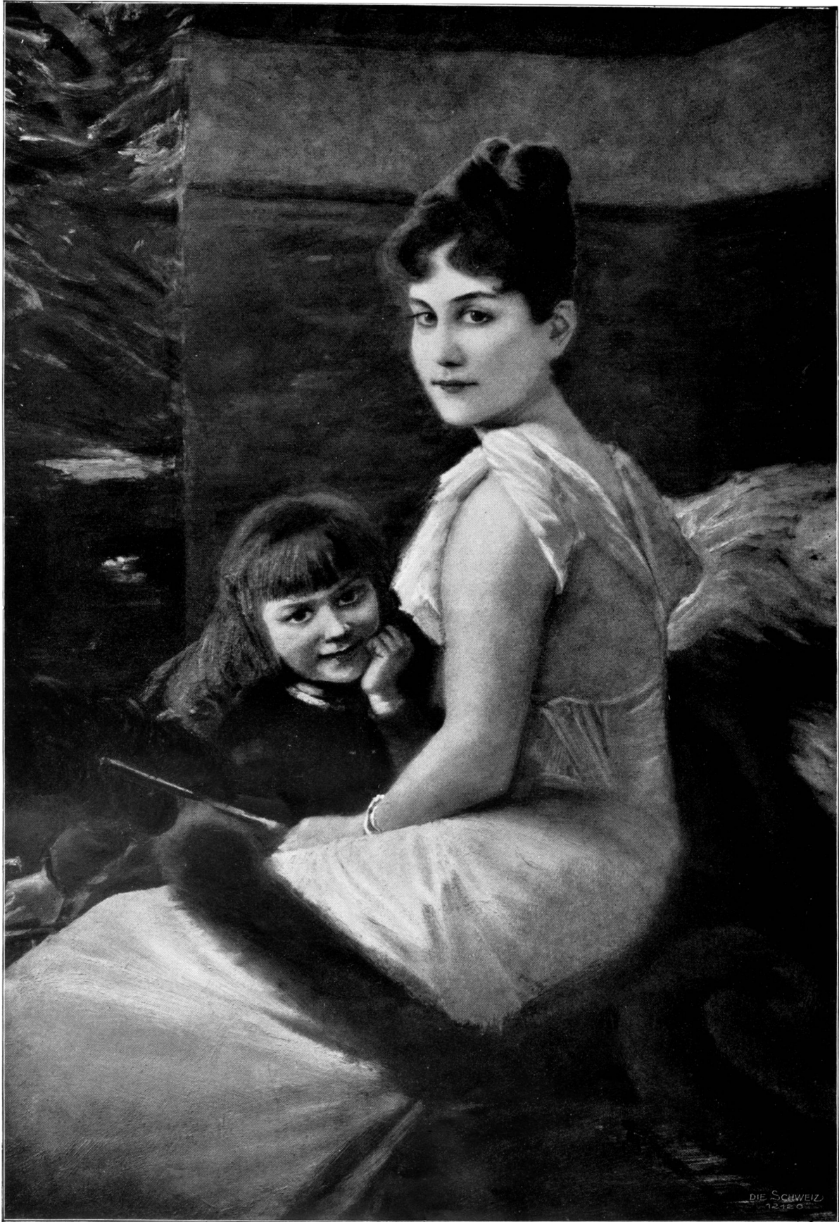
Frau von Keller mit Sohn.